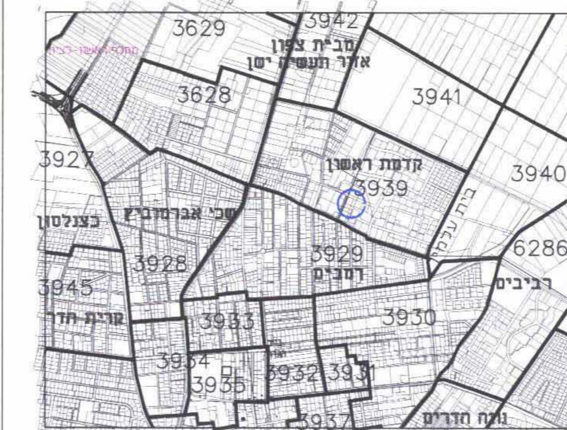
תרשים התמצאות כללית קנ"מ 1:20,000