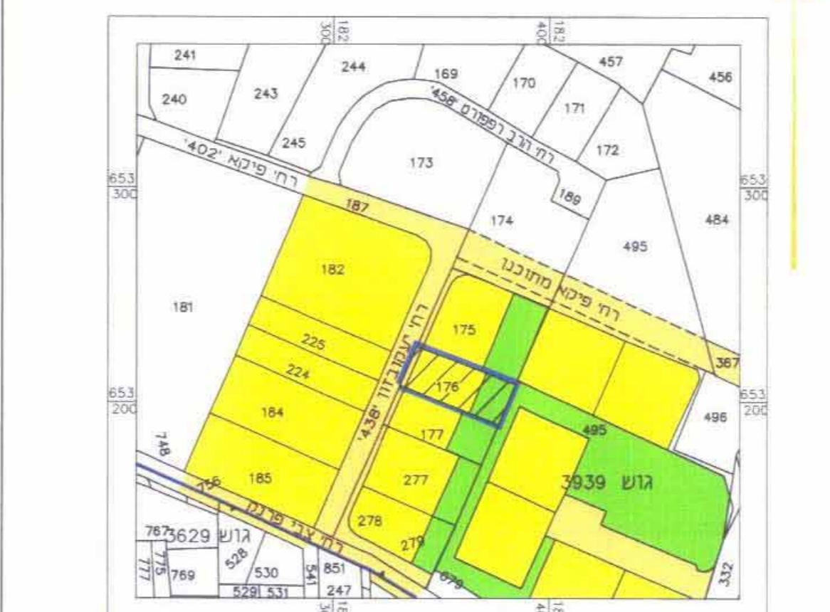
תרשים סביבה קנ"מ 1 : 2500