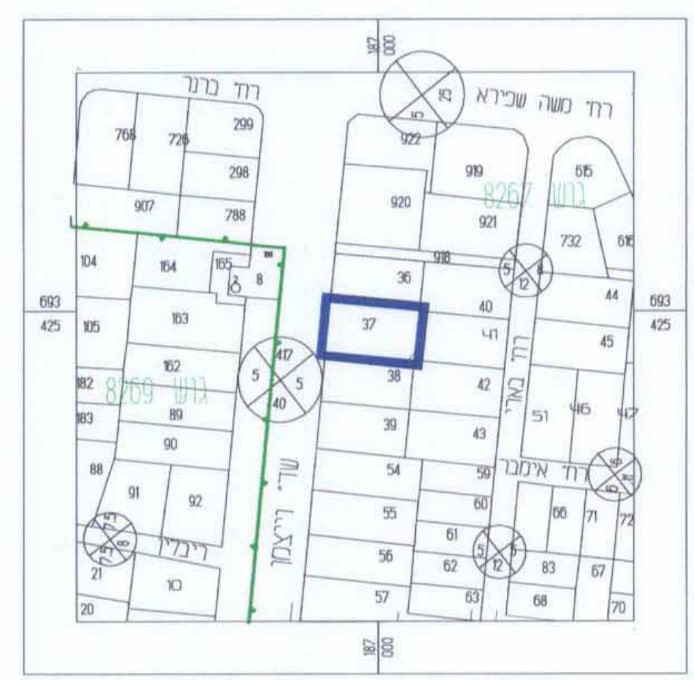
חריטים סביבה --- 1:2500