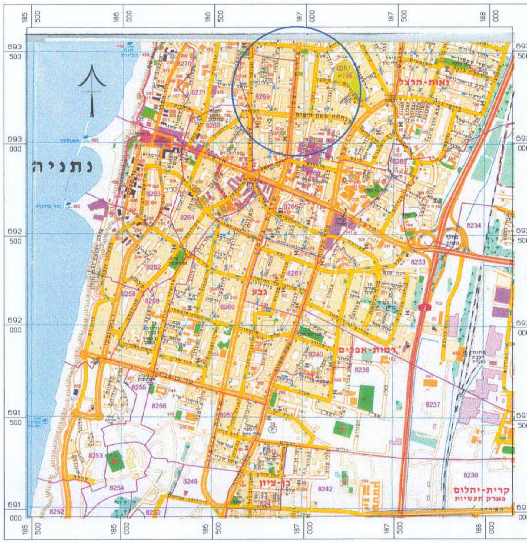
חריטים התמצאות --- 1:2500