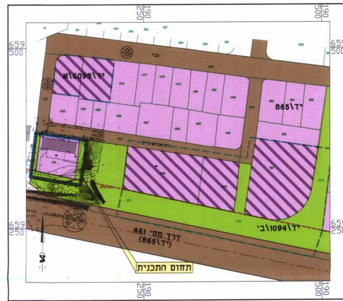
תרשים סביבה - קנ"מ 1:2,500