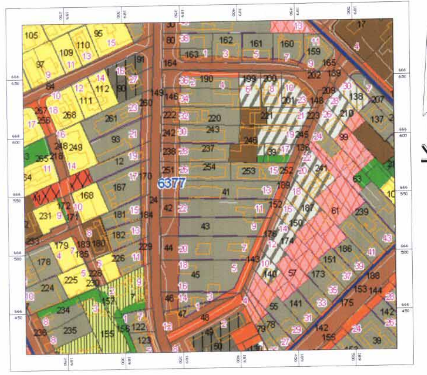
תרשים סביבה קנ"מ 1 : 2500