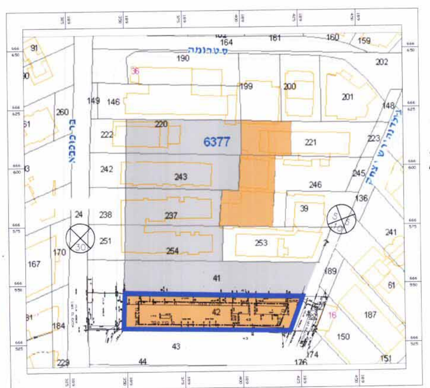
מצב מוצע קנ"מ 1 : 1250