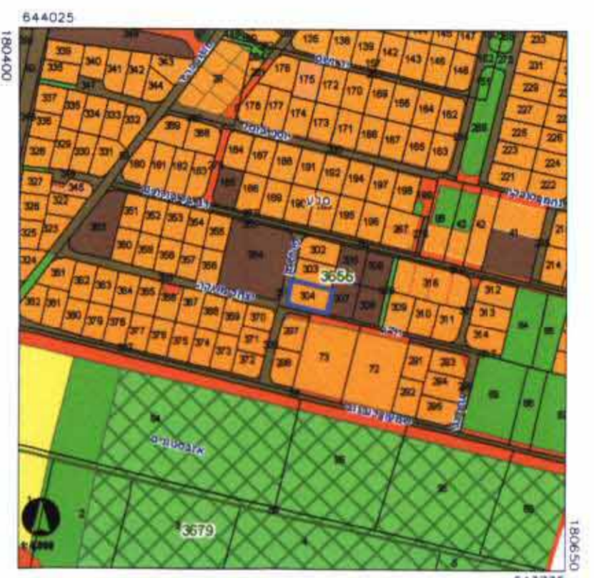
תרשים סביבה קני"מ 12,500