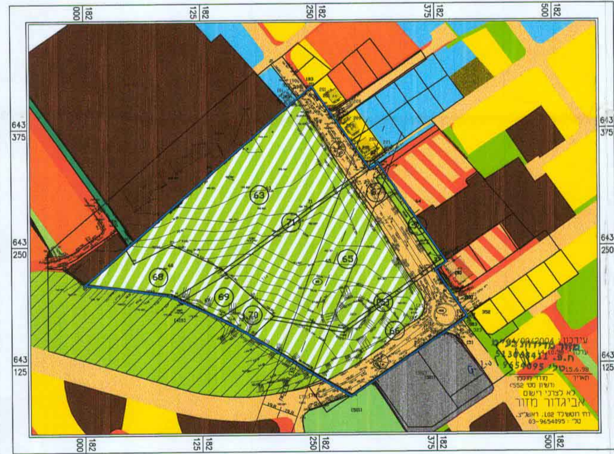
מצב קיים 1:2500