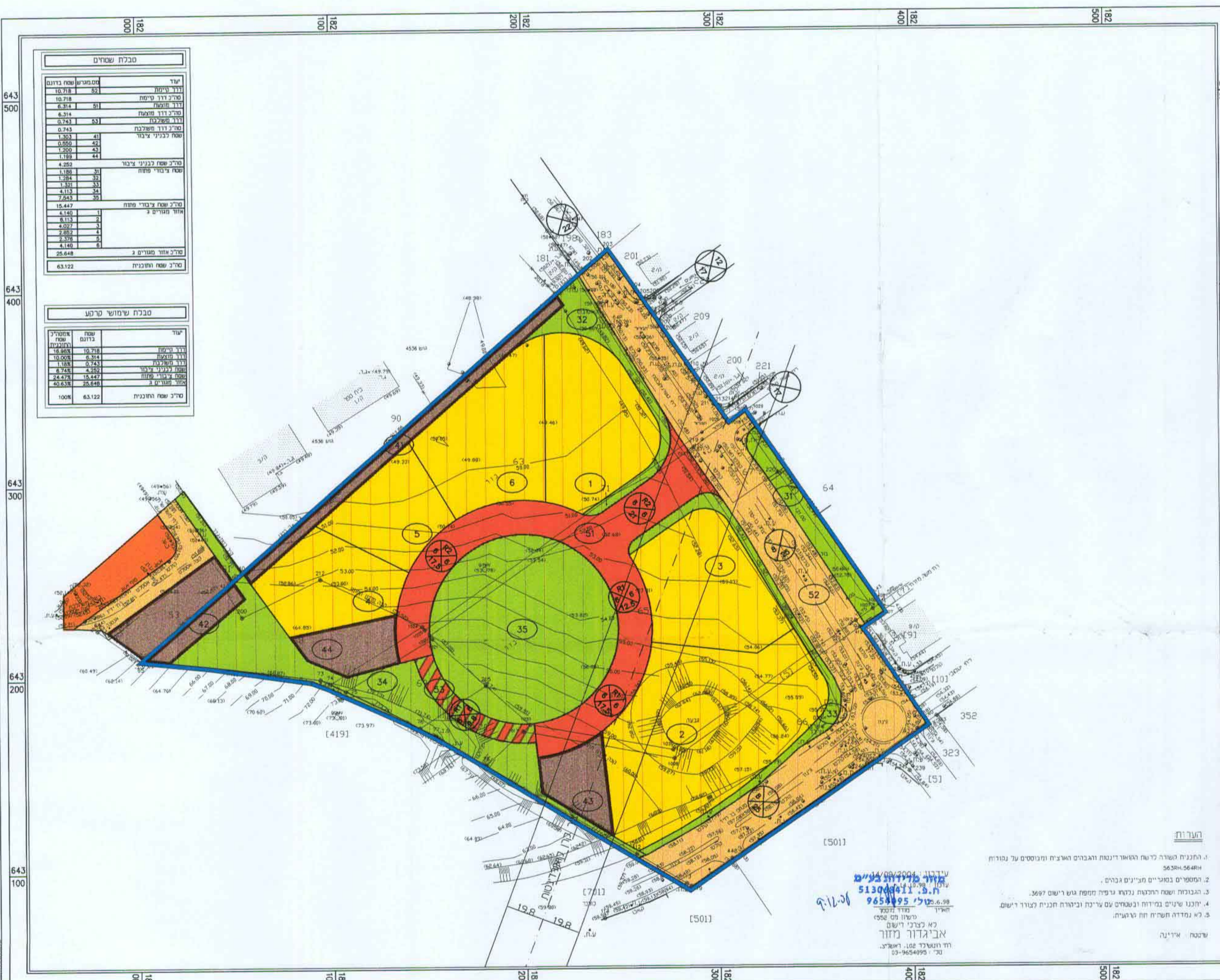
מצב מוצע 1:250