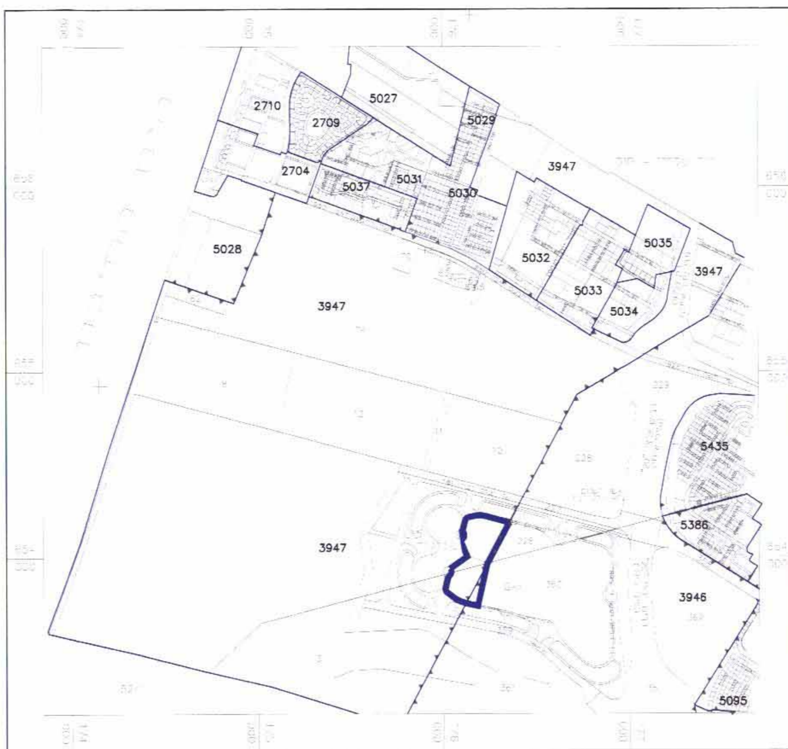
תרשים סביבה קנ"מ 1:20,000