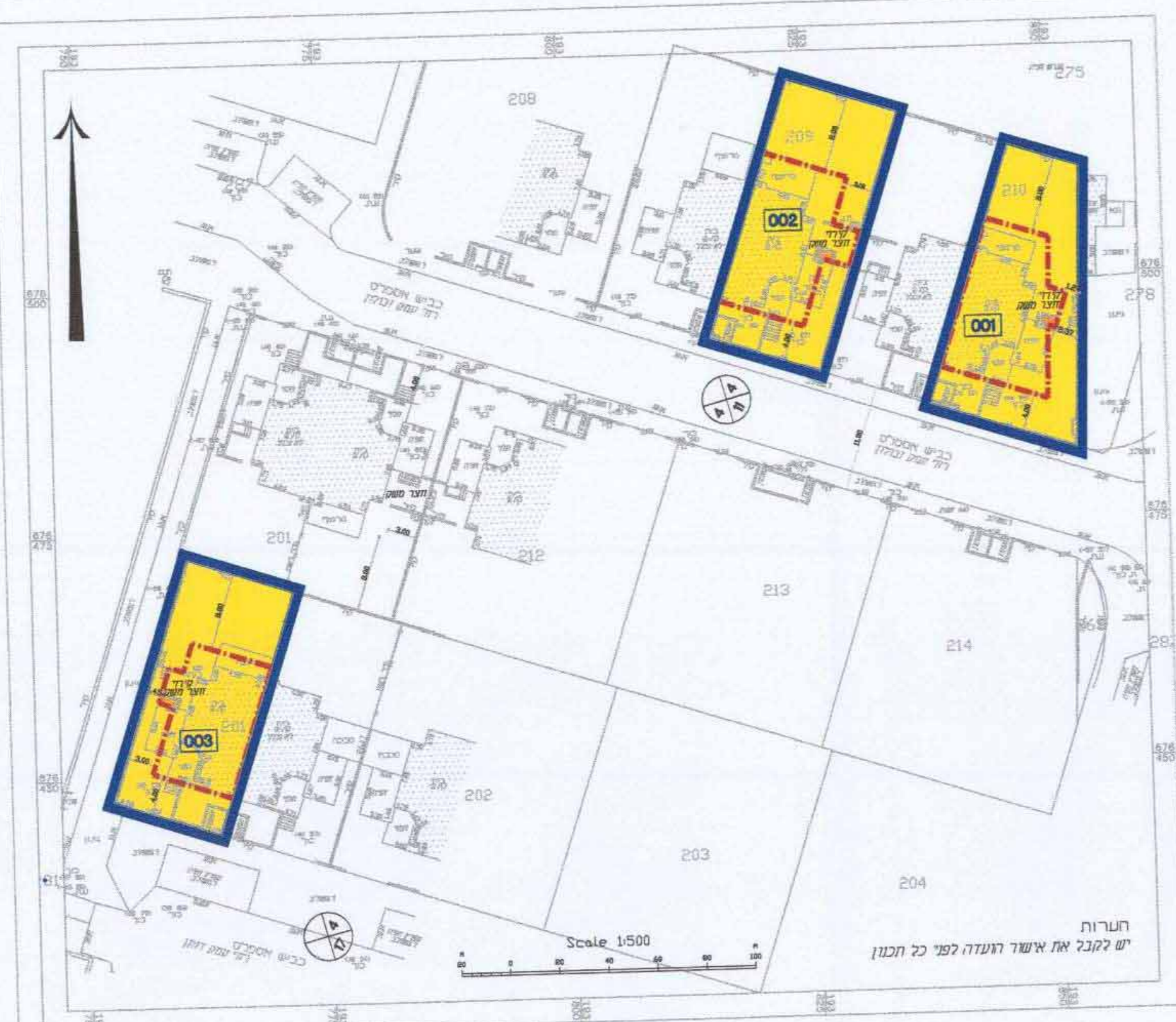
מצב מוצע 1:500

אין מאשר בית כי נוסף זה הוא נעשה נכון על הסמך הסטטיסטית אומדת על סמך מידות שטחיות בלבד. 2008 - שנת וכי כל המידות שצוינו בהסמך הם מדידות ודגומה הוא א הסמך ביצעו בהתאם לתקנות התכנון ומידות ומדידות 1998-10. מסאיור חוסאם - מודד מוסמך מר 894 פ"ת 40400 שש"ל 052-46073 09-7990140 טל 09-7990140 פקס 09-7990140 דוא"ר EMAIL: HAMEDE@BEZEQINT.NET