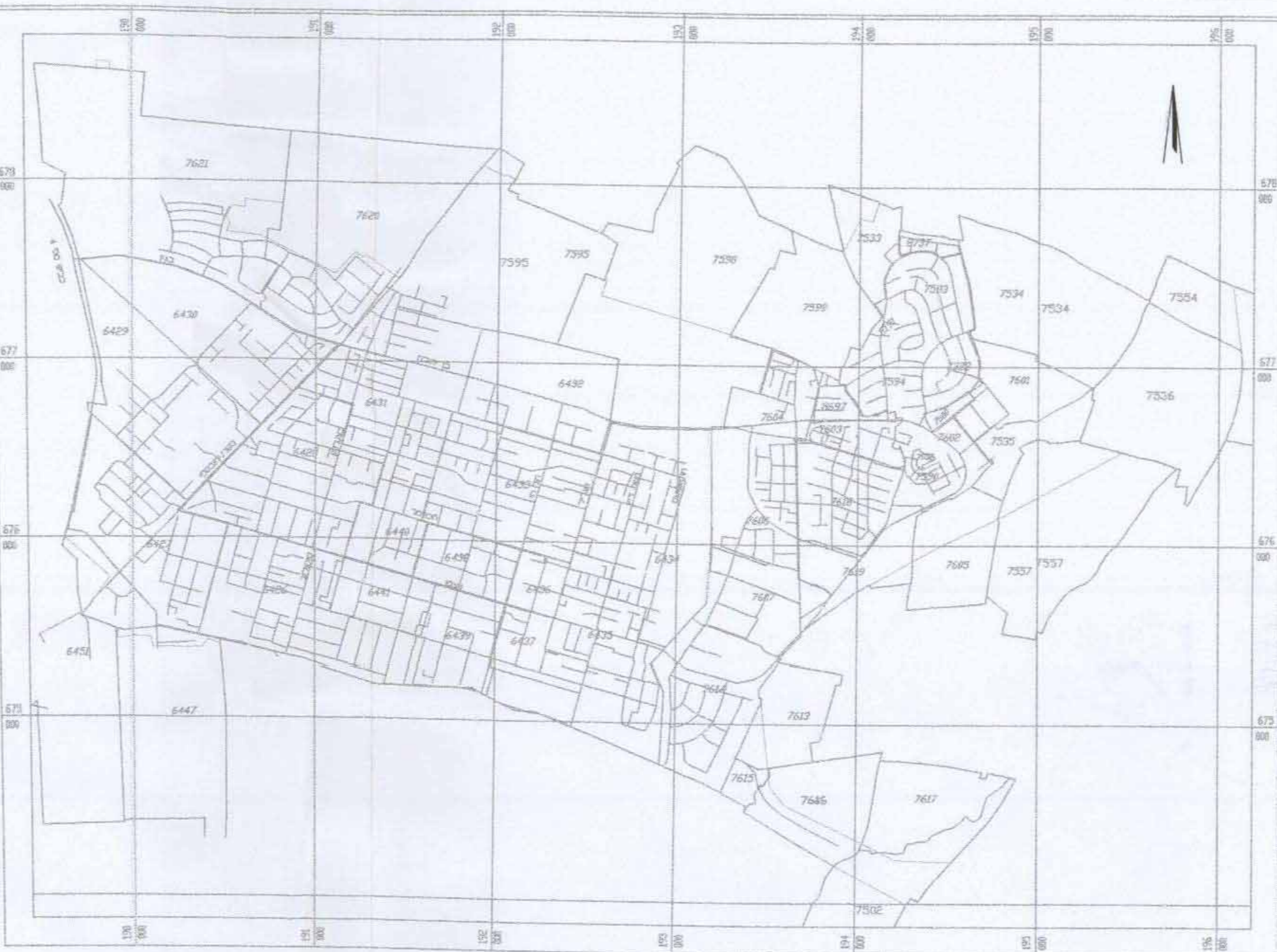
תרשים התמצאות 1:40000