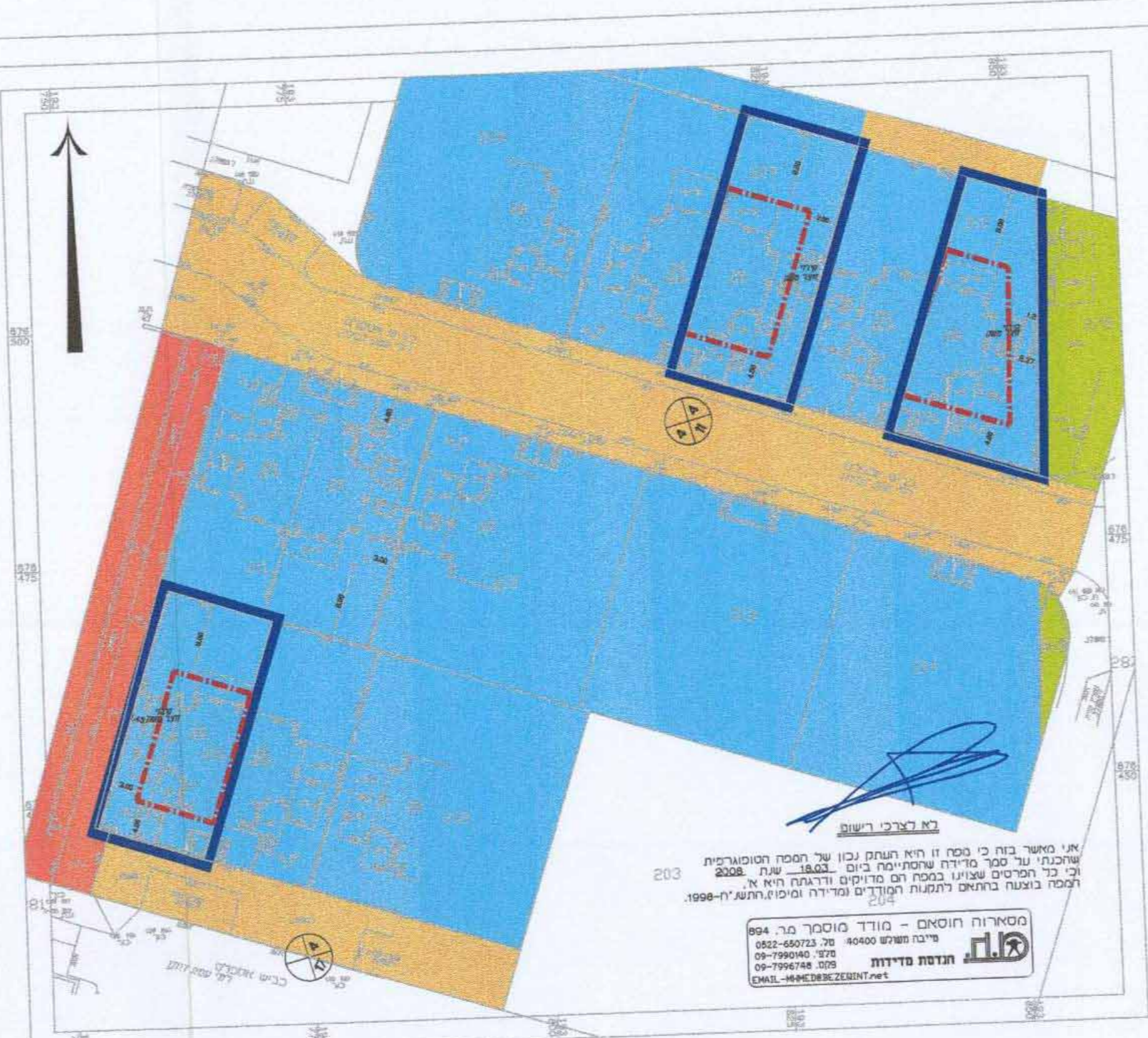
מצב מאושר 1:500