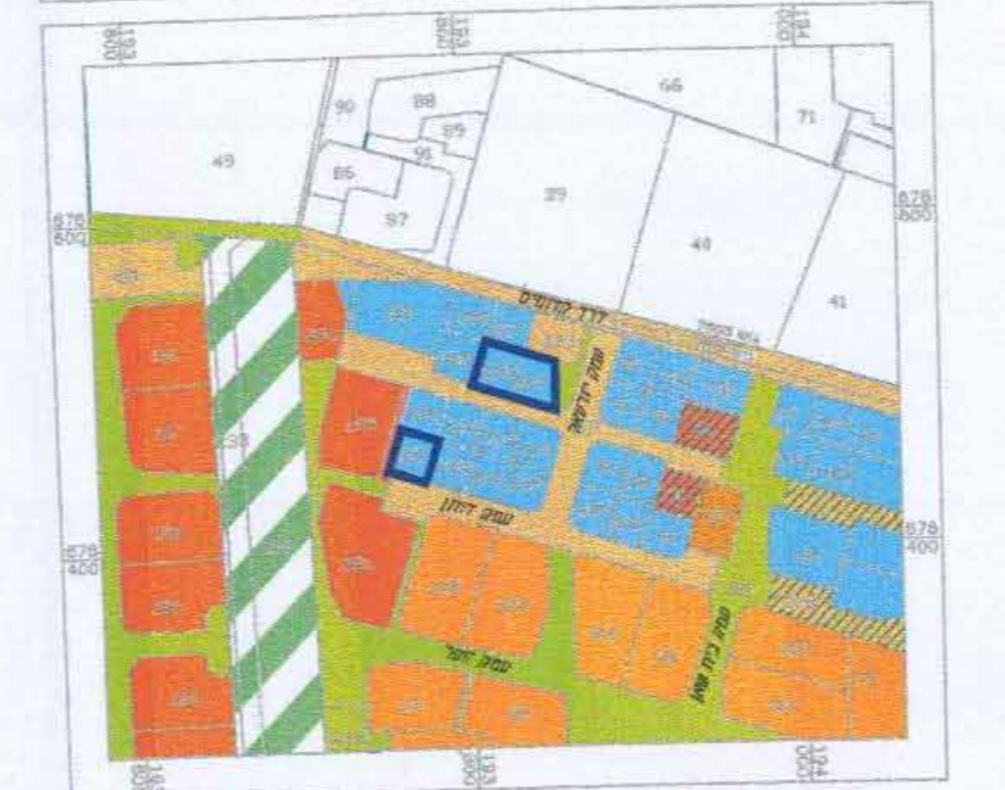
תרשים סביבה 1:5000