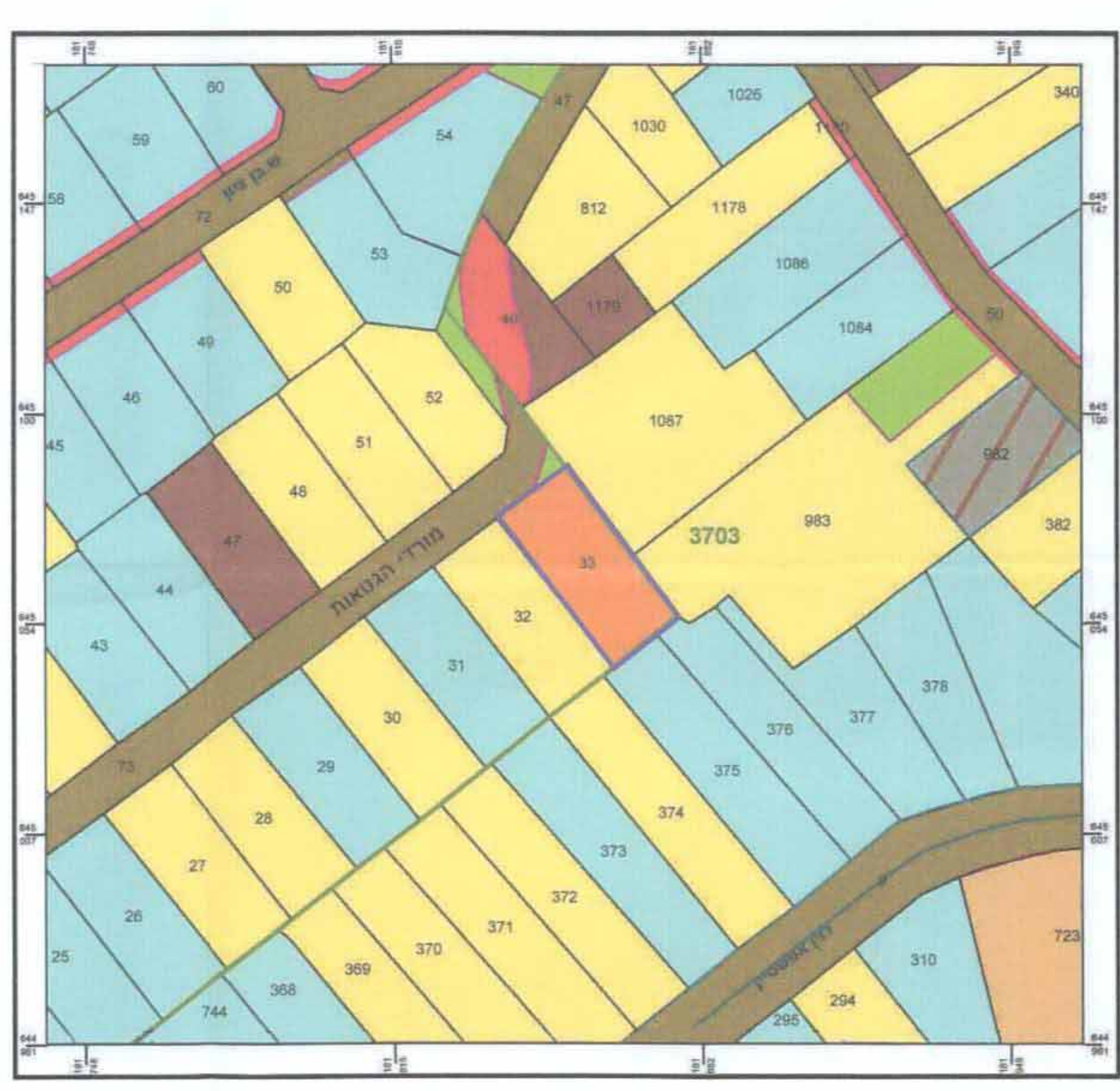
תרשים סביבה 2 קנ"מ 1:1,250

ממד באגודת המודדים המוסמכים בישראל אביגדור מזור ממד מסמך מס' 582 רח' רוטשילד 202, רמת השרון 03-9654095