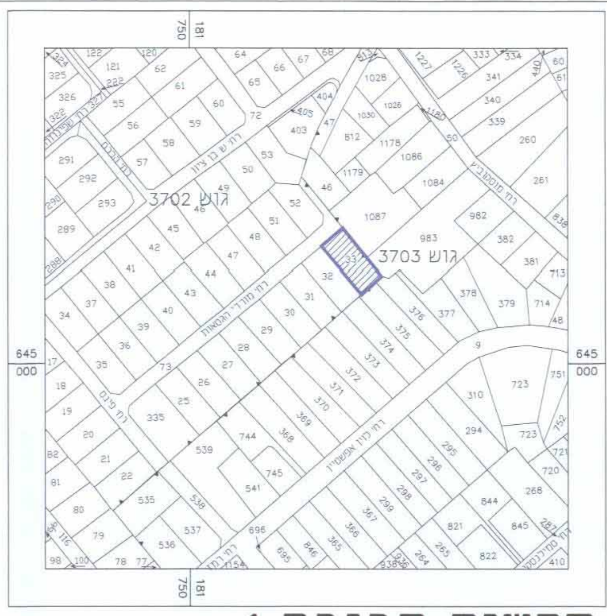
תרשים סביבה 1 קנ"מ 1:2,500