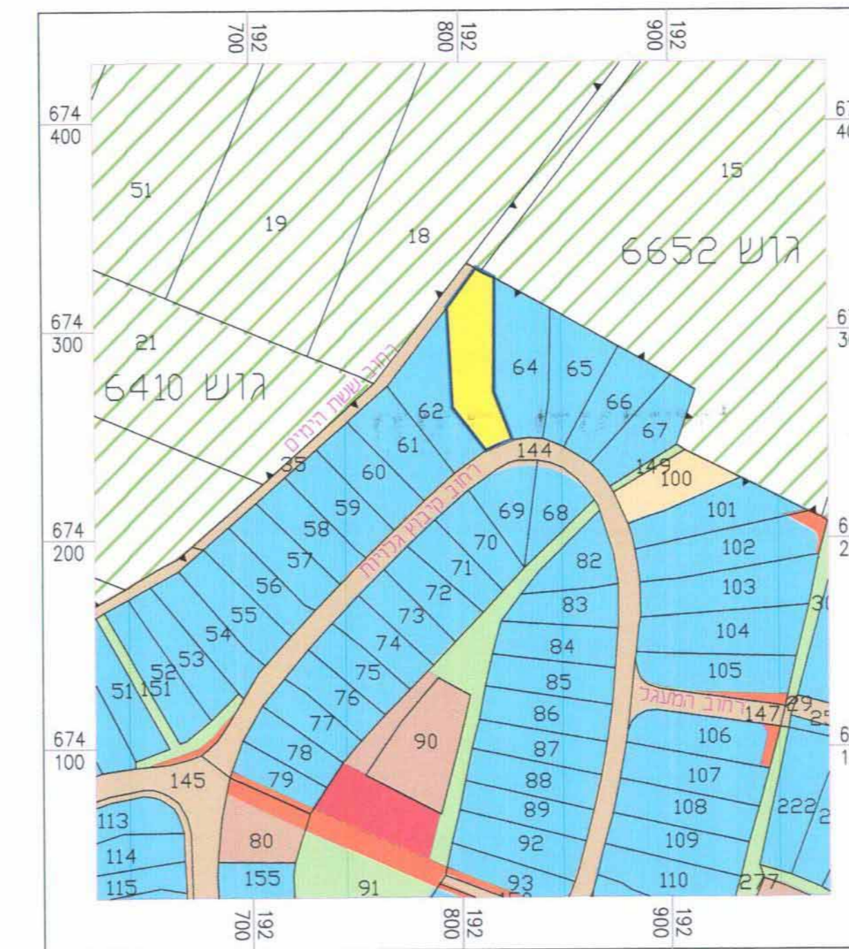
תרשים סביבה קנ"מ 1:2500