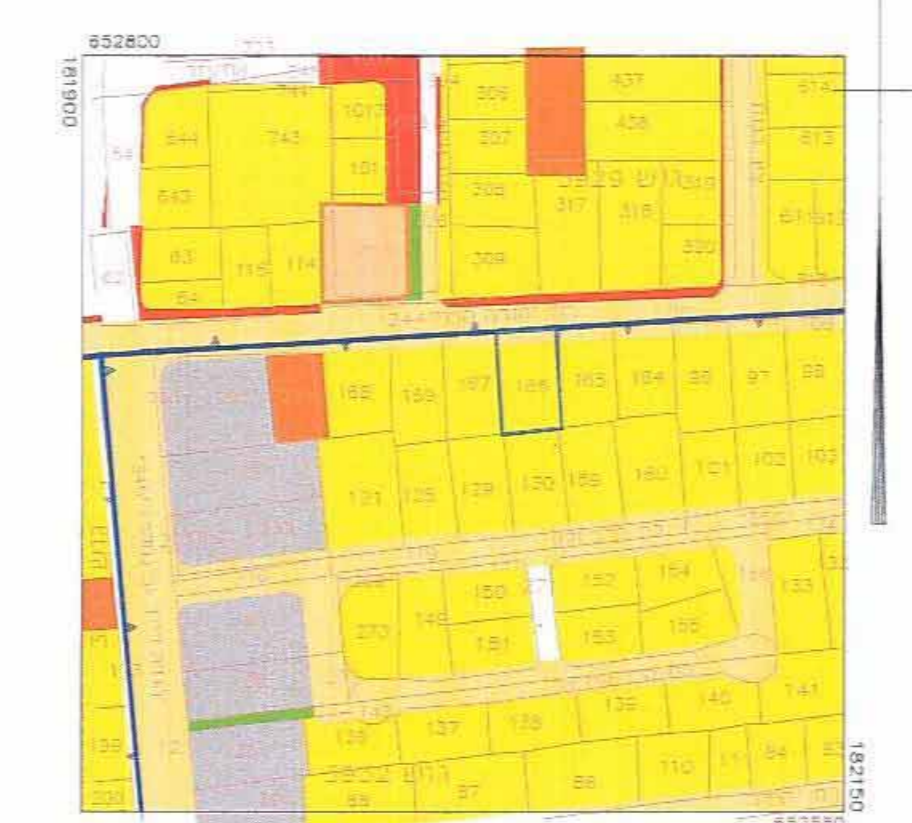
תרשים סביבה 1:2500

מקרא תרשים סביבה גבול התכנית: קו בול מגורים ג': צבע צהוב בנין ציבורי: צבע אדום אזור מחזורי: צבע אפור דרך מאושרת: צבע צהוב