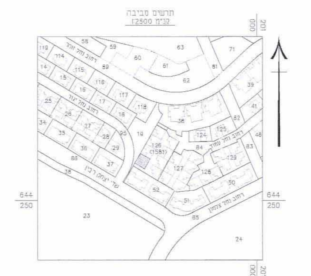
תרשים סביבה קרובה קנ"מ 1:2,500