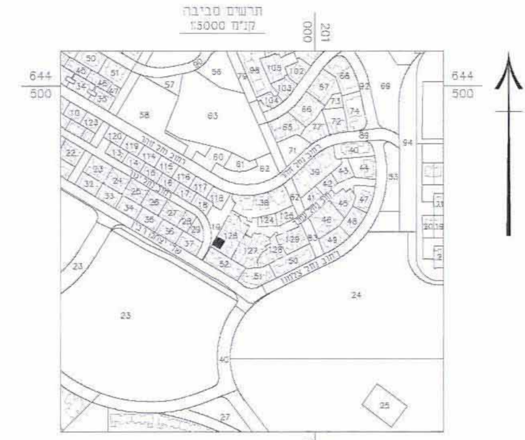
תרשים התמצאות כללי קנ"מ 1:5,000