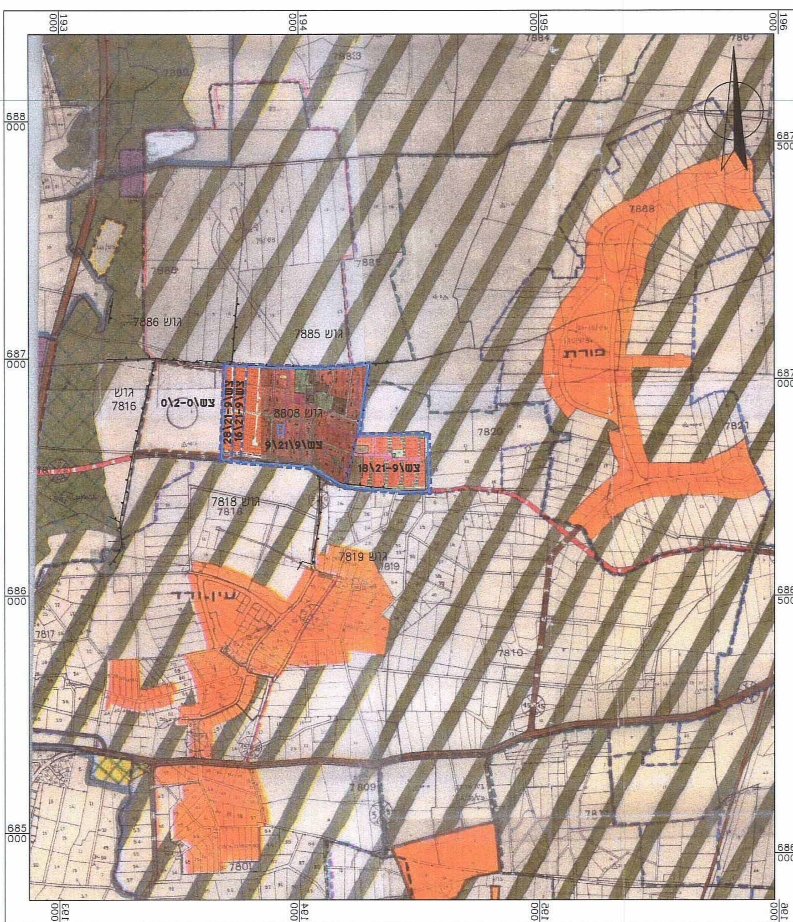
מצב מאושר - כולל סימון יעוי הקרקע עפ"י תכנית תקפות ק"מ 1:10000