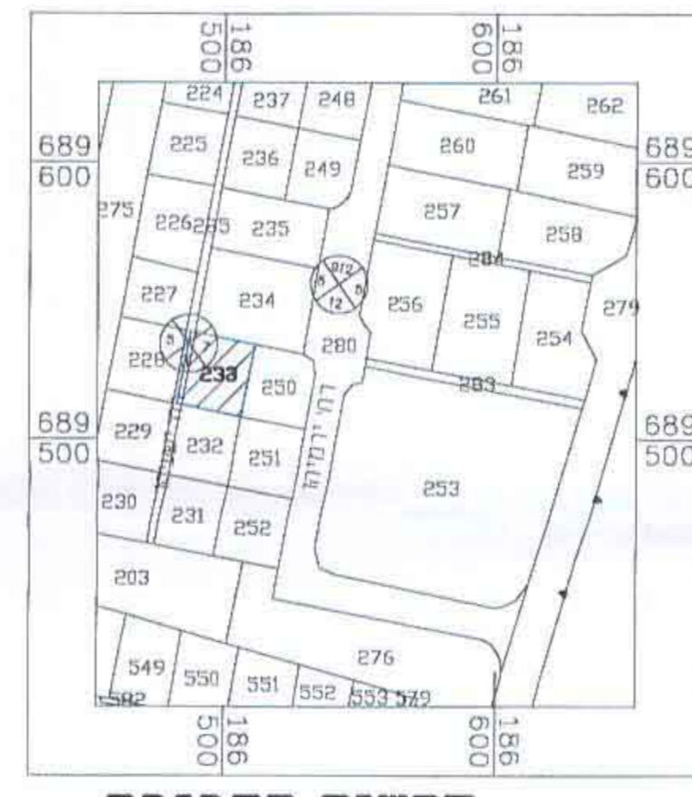
תרשים הסביבה 1:2500.ק.נ.