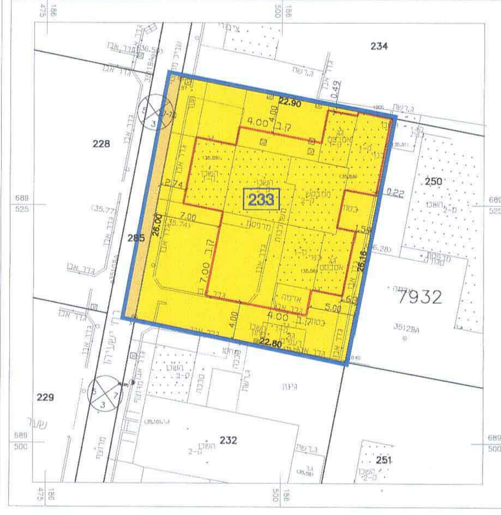
מצב מוצע 1:250