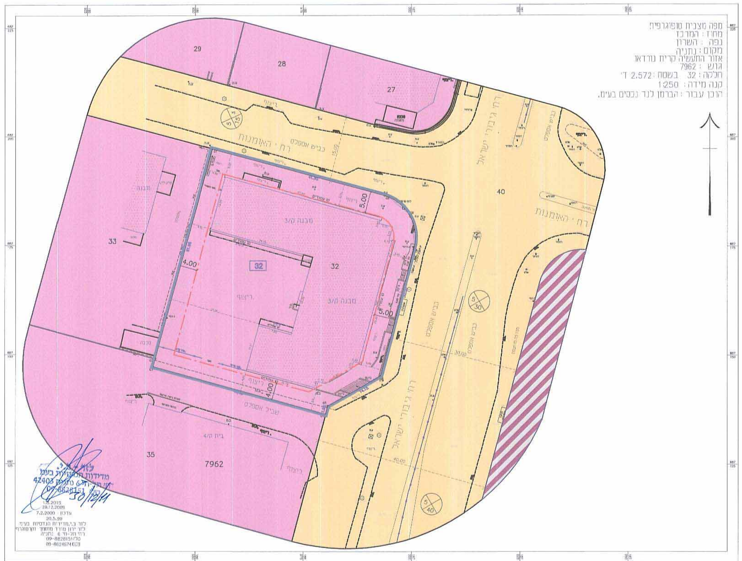
מצב מאושר קנה מידה 1:500