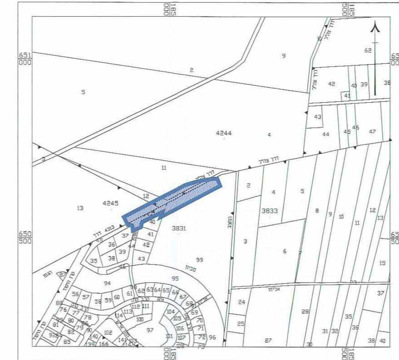
תרשים הסביבה הקרובה - 1:5000