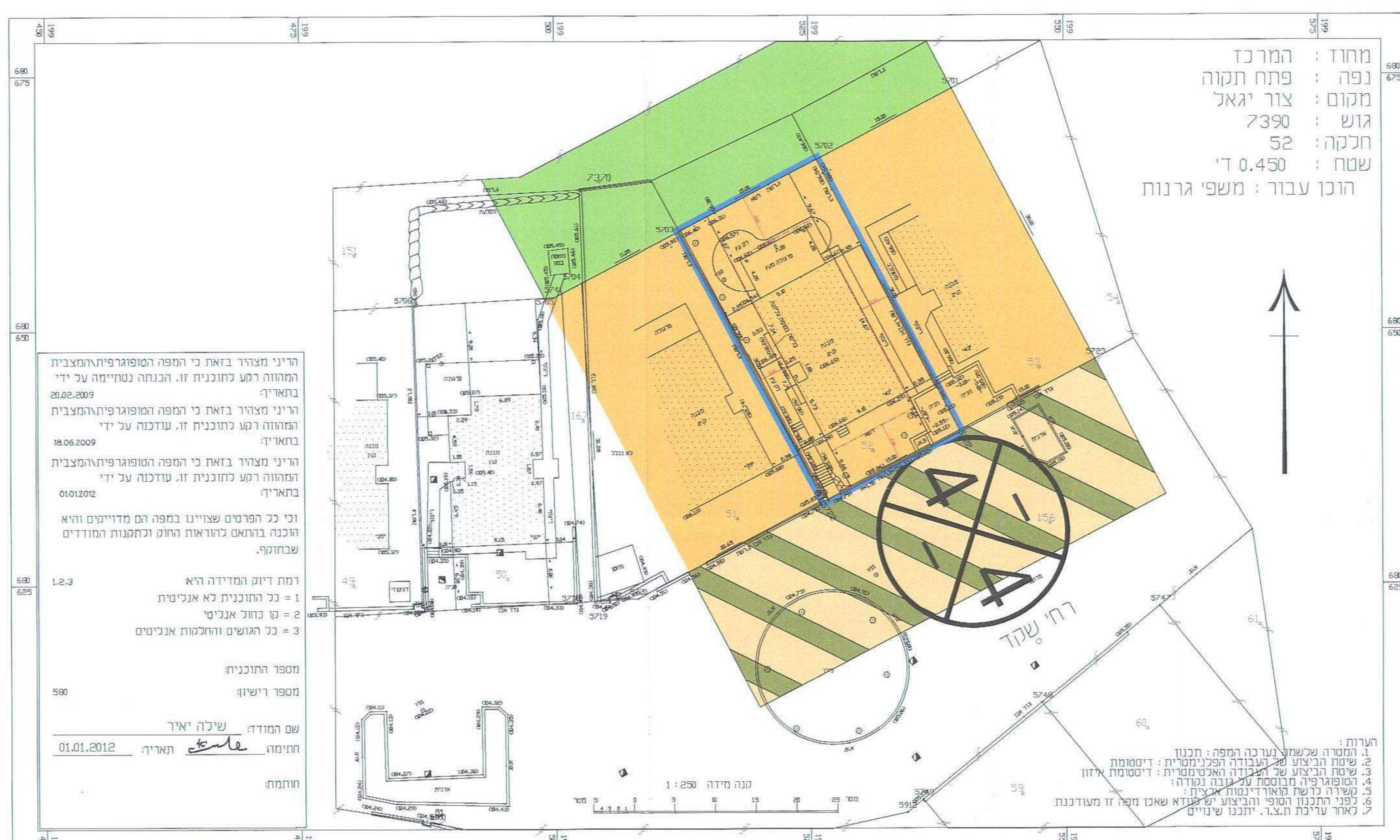
מצב מאושר 1:250