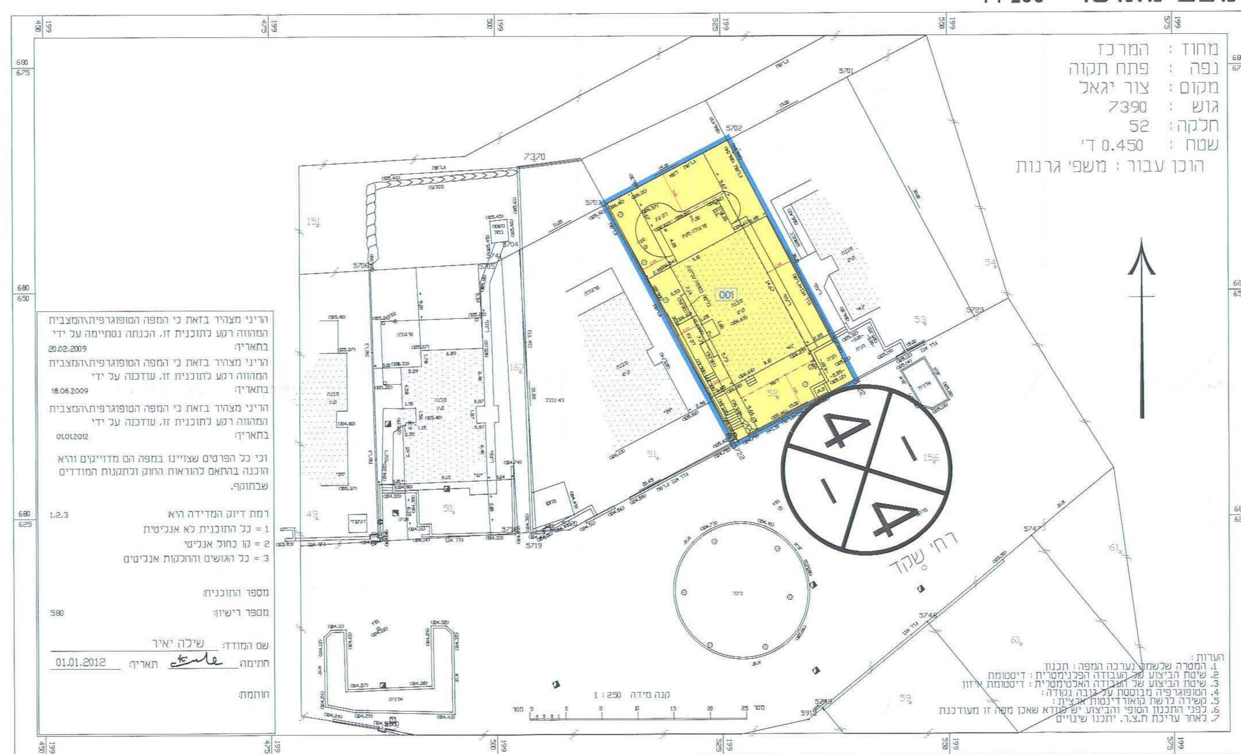
מצב מוצע 1:250

הריני מצהיר בזאת כי המפה המפורטת/תכנית המפורטת רשמה וקנה מחמת זי, שדוכנה כיום-2012-08-15 והיא רכונה לפי תרואת מנהל מנדלוג ובהתאם לתקנות החוק והתקנות המודדים שבתוקף. רמת דיוק המדידה היא 1 = כל הזוטרות לא אנליטיות 2 = קו כחול אנליטי 3 = כל הגושים והחלקות אנליטיים מספר הזוטרות מספר רישון שם המודד: שילה יאיר חתימה: 01.01.2012 תאריך