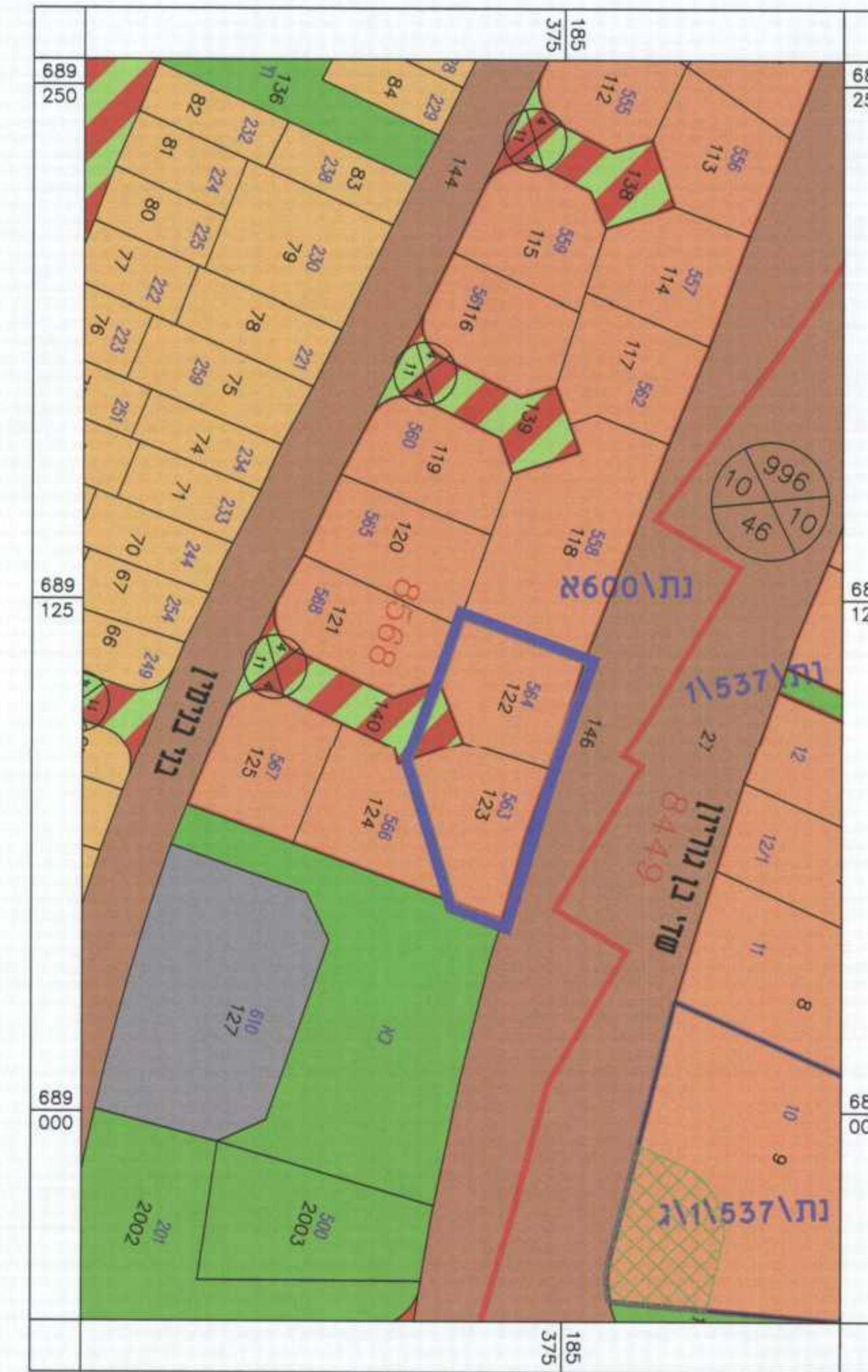
תרשים סביבה קני"מ 1250 : 1