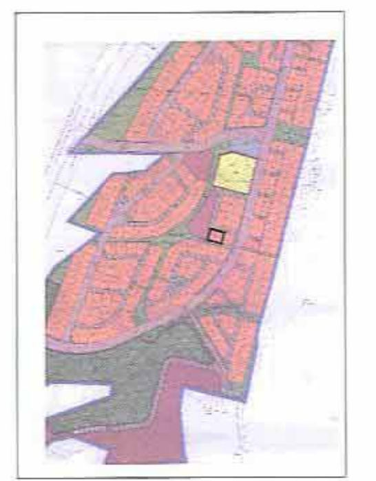
תרשים סביבה קנ"מ 1:10,000