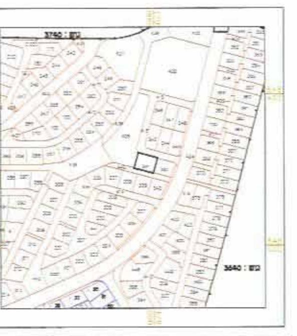
תרשים סביבה קנ"מ 1:5000