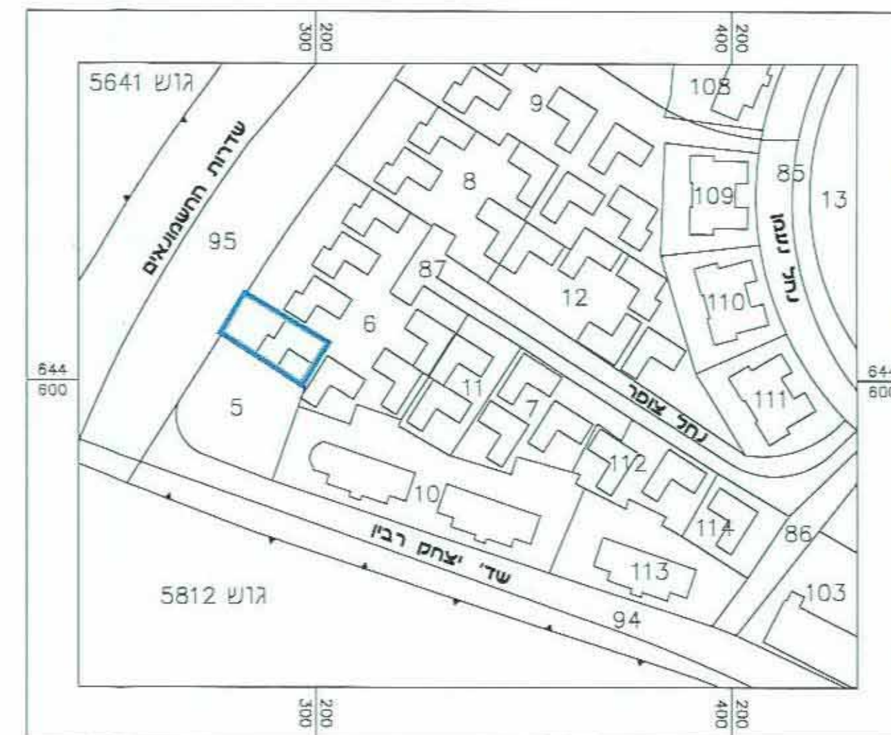
תרשים סביבה קרובה קנ"מ 1:1,250