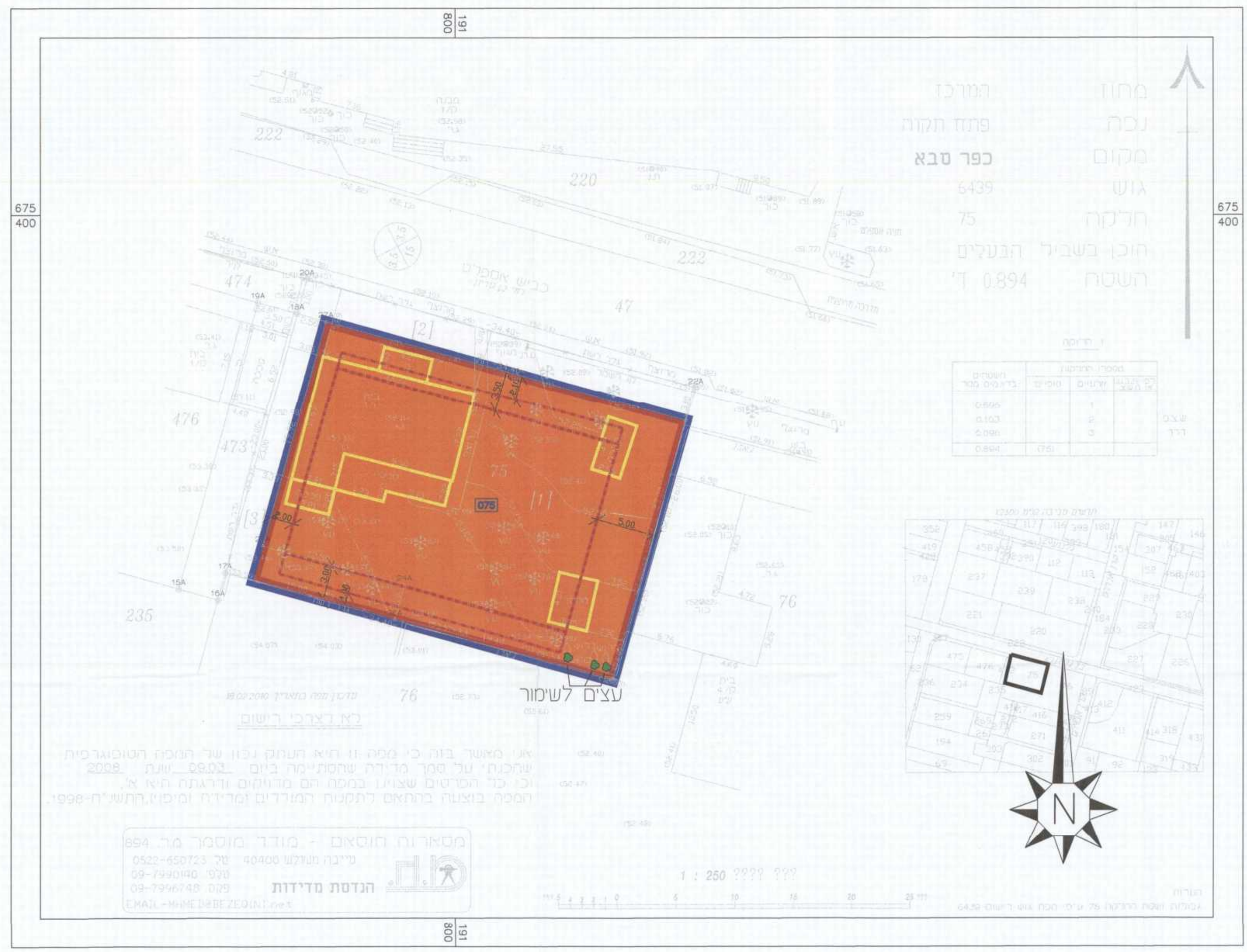
מצב מוצע 1:250