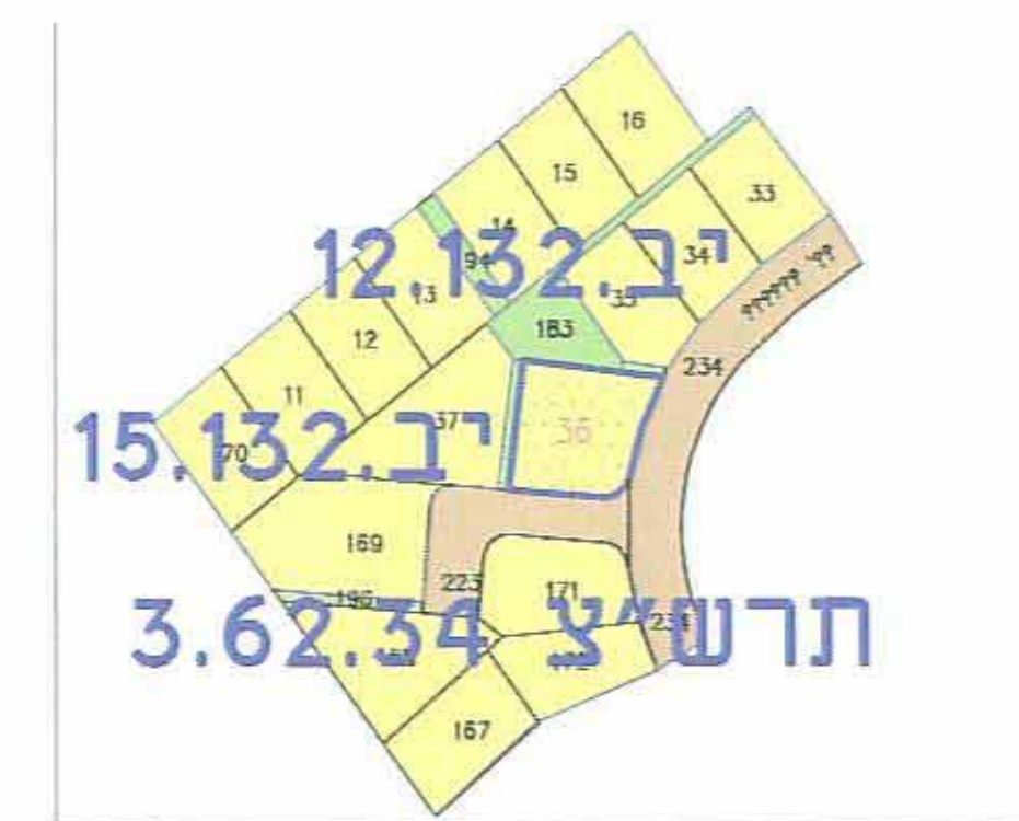
תרשים סביבה קרובה ק.מ. 1:1250

חוק התכנון והבניה תשכ"ח-1968 ועדה מקומית לתכנון ובניה יבנה