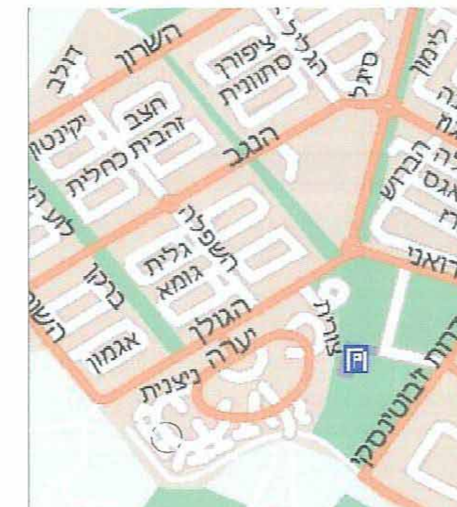
תרשים סביבה קרובה ק.מ. 1:10000