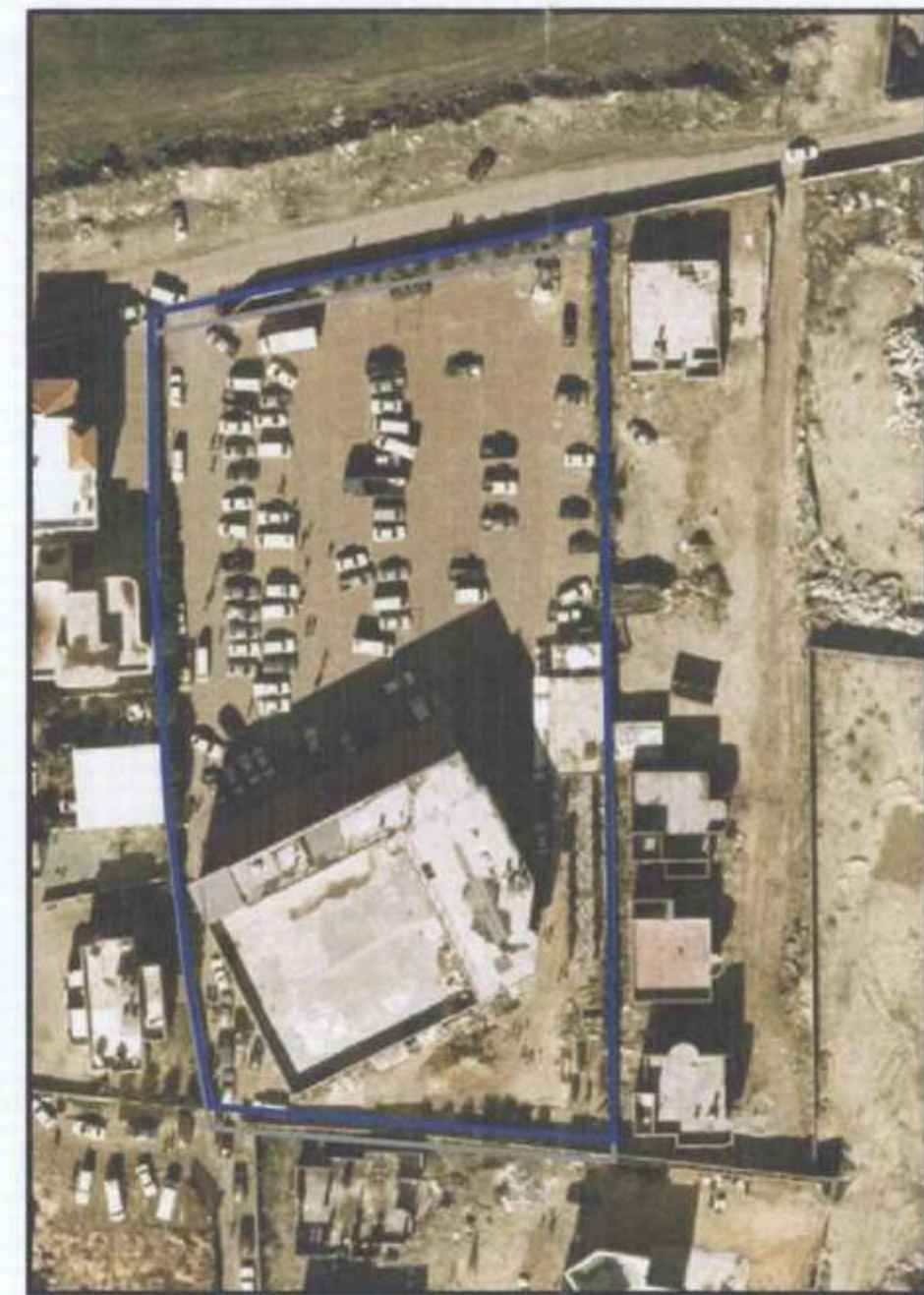
תצ"א 17/12/04 קנ"מ 1:1,000