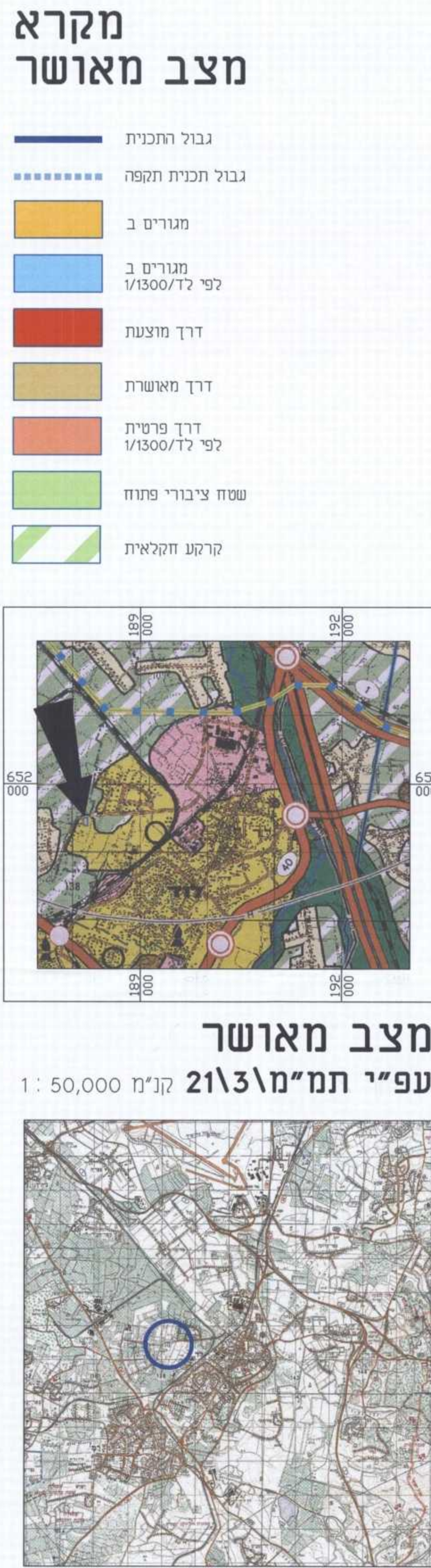
תרשים סביבה קנ"מ 1:100,000