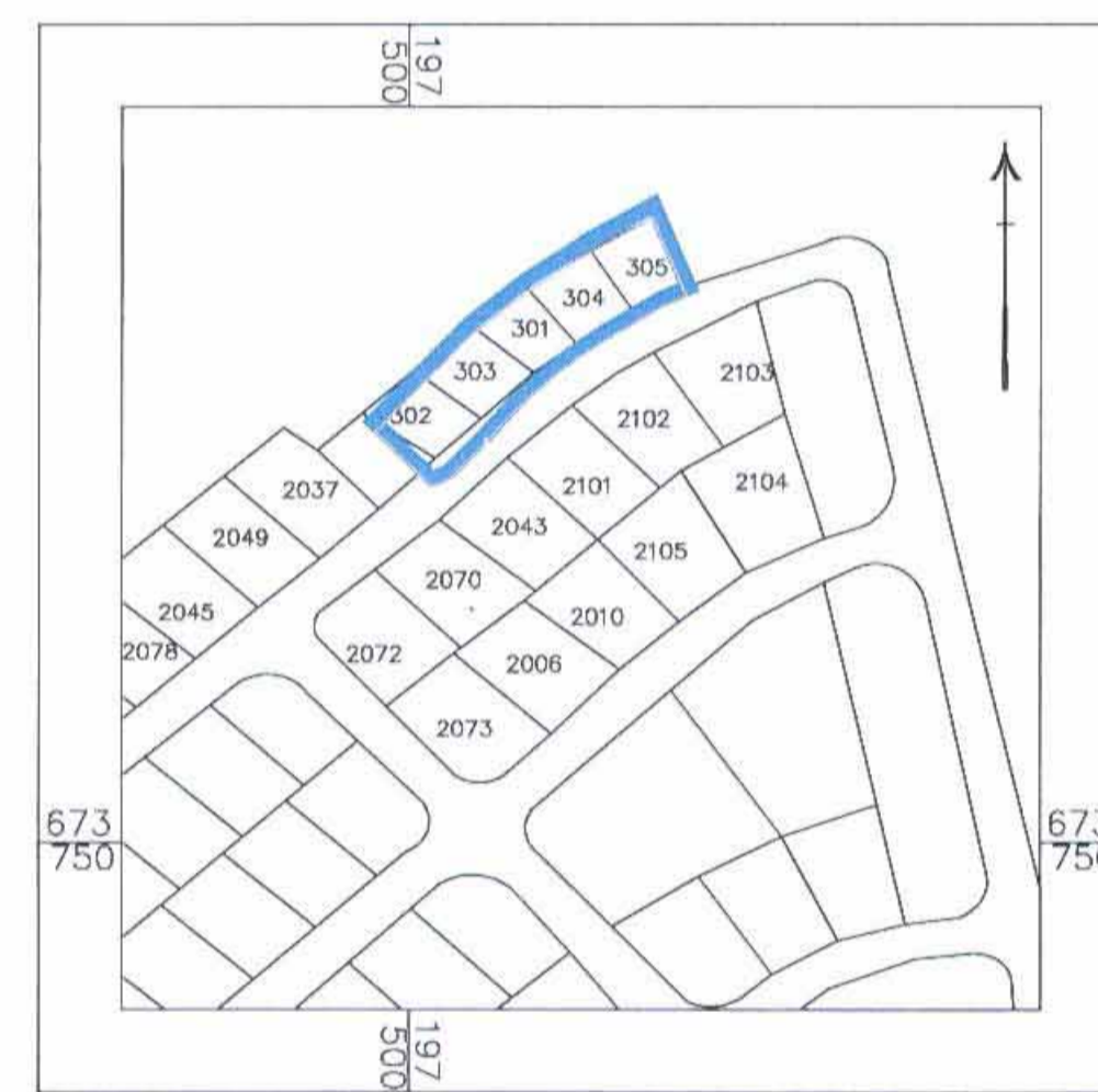
קנ"מ 1:2500 תרשים סביבה