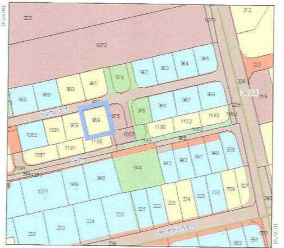
תרשים סביבה קנ"מ 1:2500