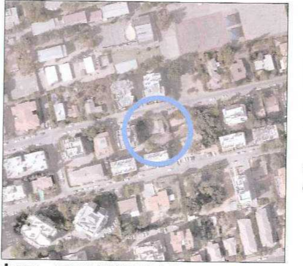
תרשים התמצאות כללי

עריית רחובות מינהל הנדסה 2013-03-07 כתובת: תכנית מס' רח\450\8\10\10 תכנון בנין טיפוס