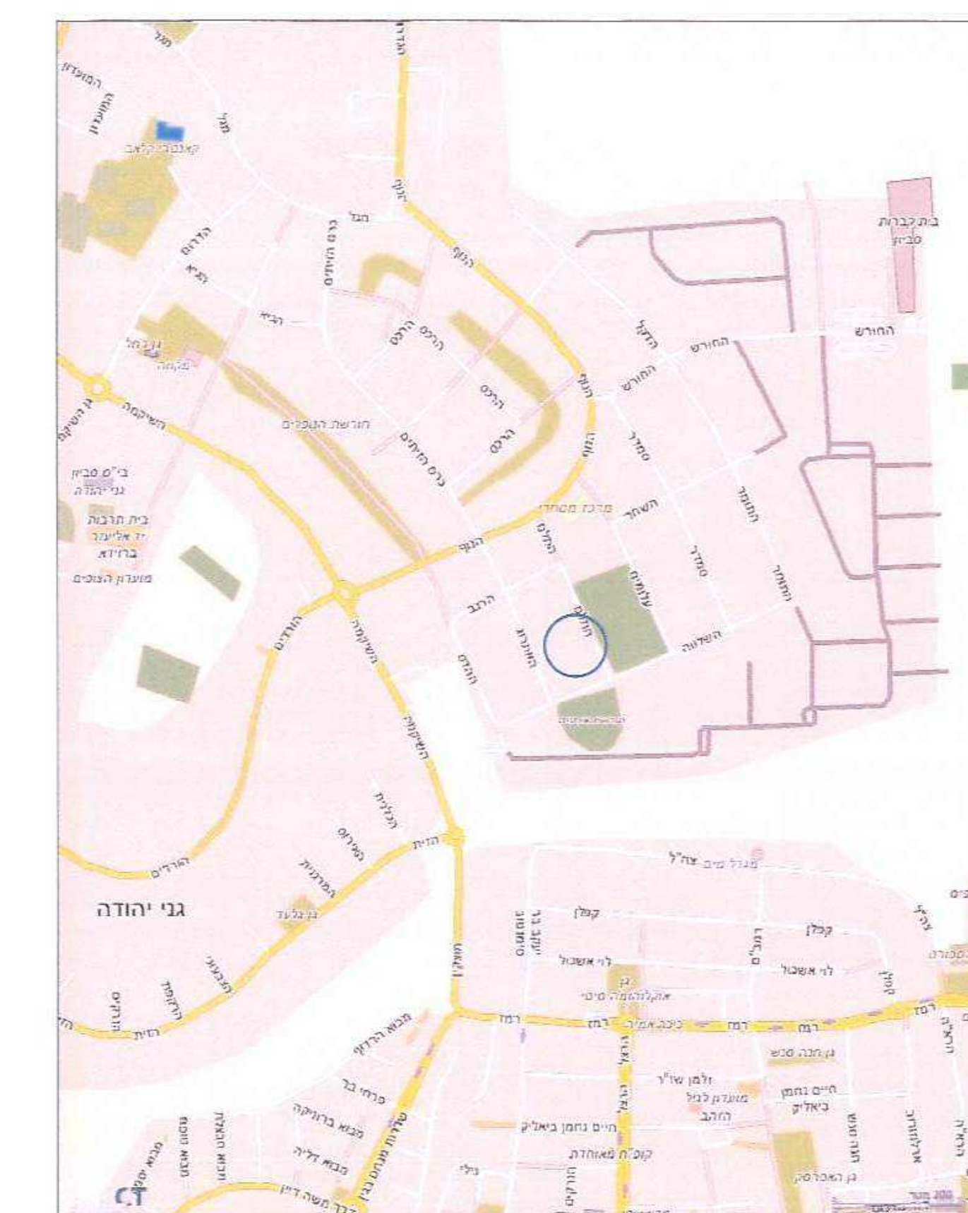
תרשים סביבה כללית קנ"מ 1:10,000