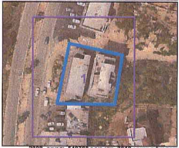
שנת צילום אוויר: 2012, מקו רחב 640780 ודרומה - 2008. ריסת מערכת 02 2012