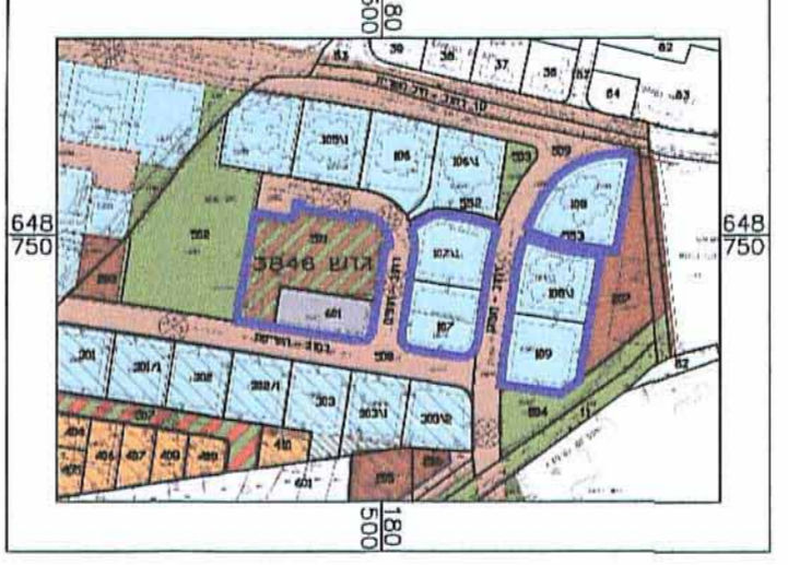
תרשים סביבה - קני"מ 1:5,000