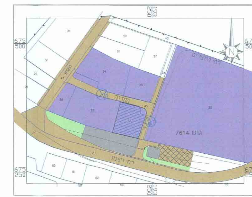
תרשים סביבה קרובה 1:2500