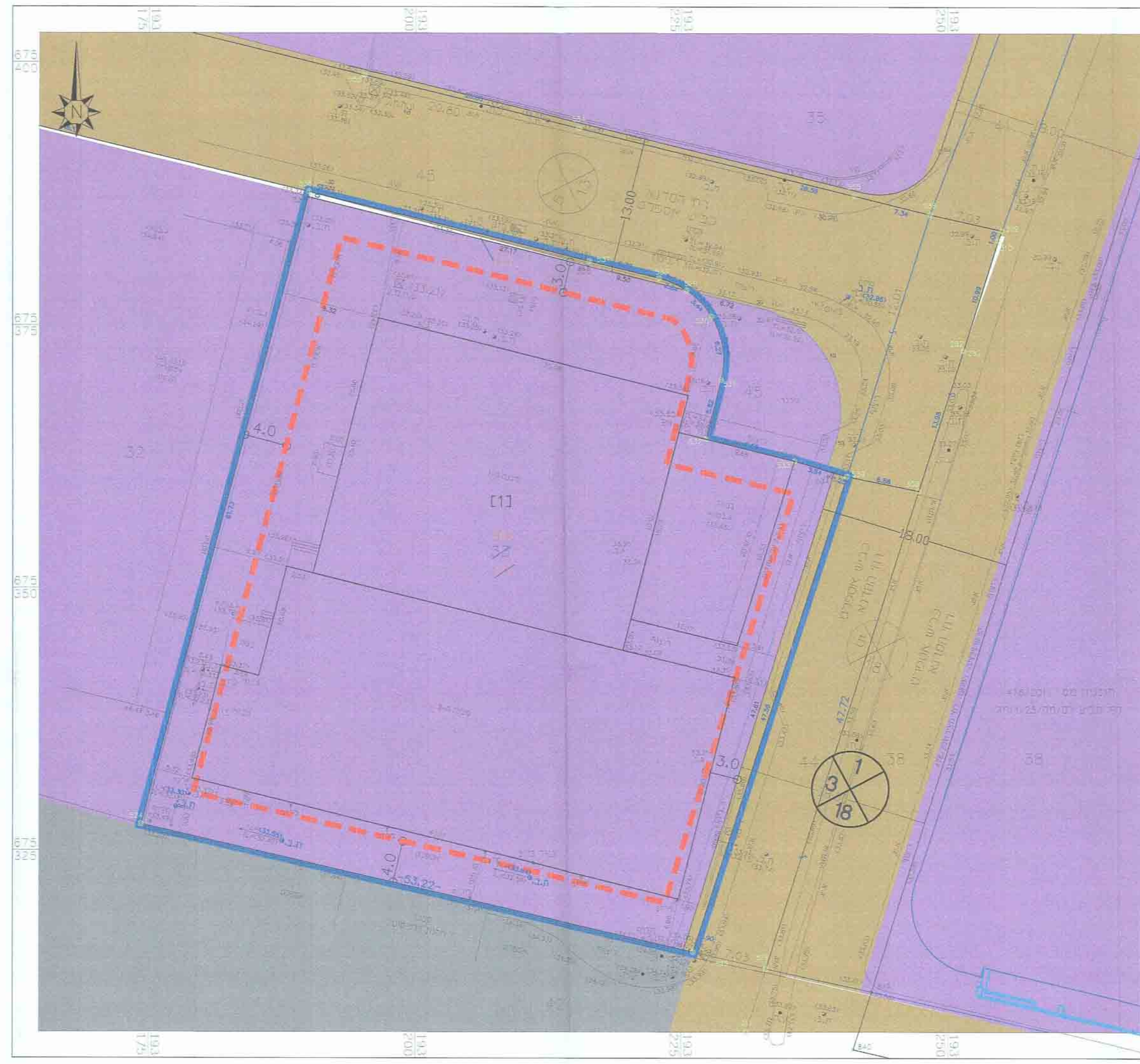
מצב מאושר 1:250

1. מידע כללי שם התכנית: תכנית מפורטת מס' כס/א/25/מט מחזור: 2 תאריך: 25/6/2014 שם המגיש: מנחם גלובס כתובת: ז'בוטינסקי 188 בני ברק טלפון: 03-5790222 דוא"ר: 03-5790224