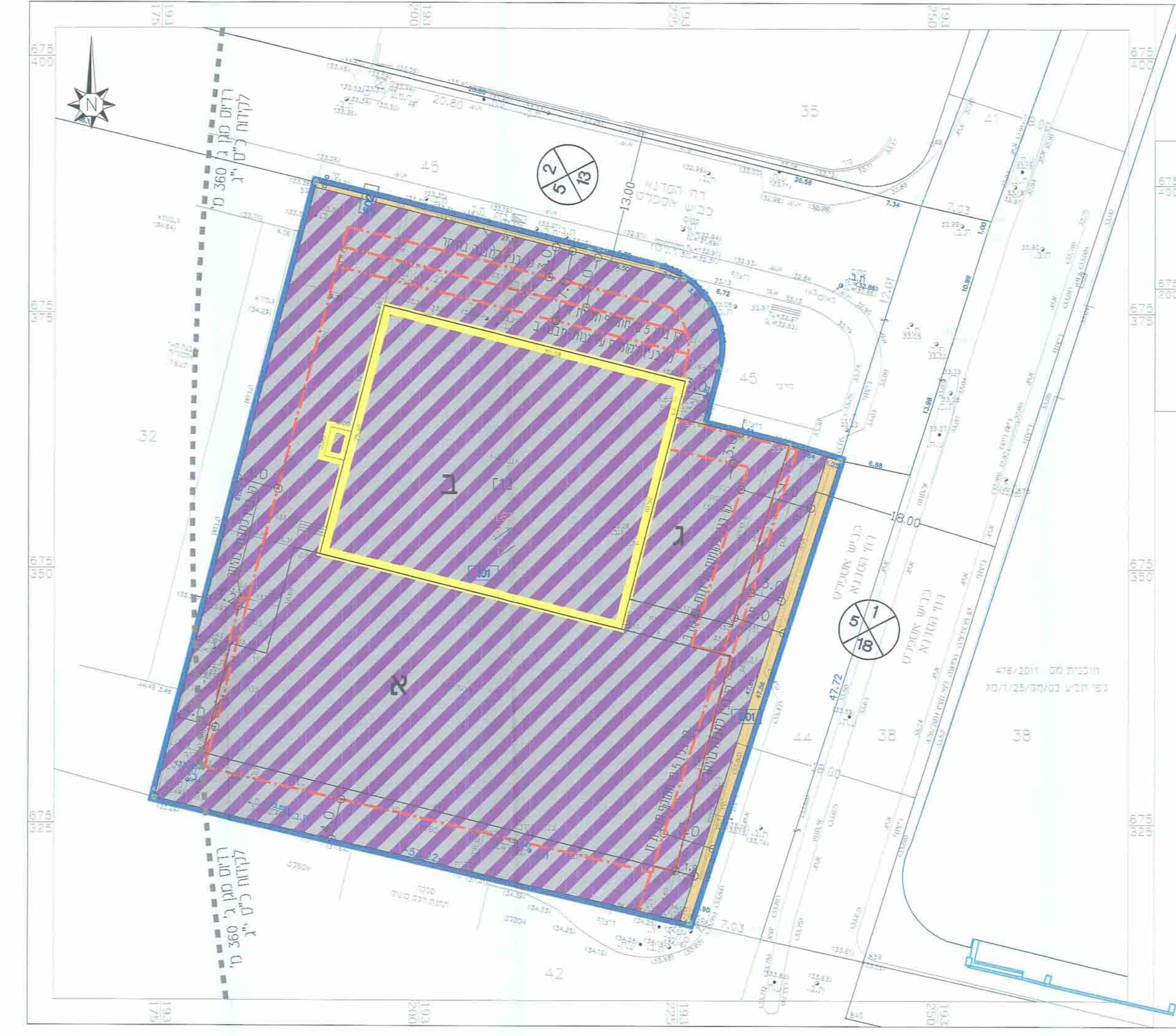
מצב מוצע 1:250

1. מידע כללי שם התכנית: תכנית מפורטת מס' כס/א/25/מט מחזור: 2 תאריך: 25/6/2014 שם המגיש: מנחם גלובס כתובת: ז'בוטינסקי 188 בני ברק טלפון: 03-5790222 דוא"ר: 03-5790224