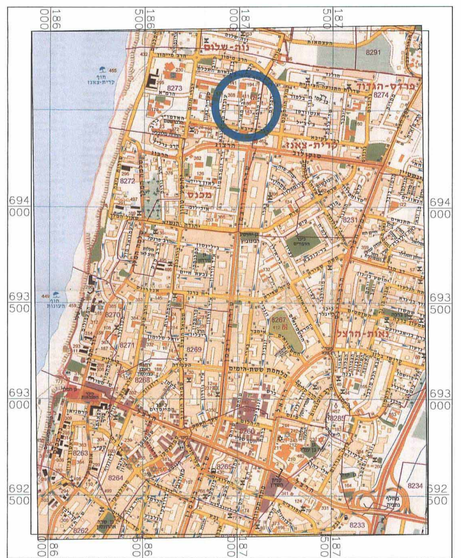
תרשים התמצאות כללי קנ"מ 1 : 12500

ועדה מקומית נתניה אישור תוכנית מס' 21/555/א עיסוק המקומות החלטה לאשר את התוכנית ביום 19.9.2014 מחלקת איונה עיריית