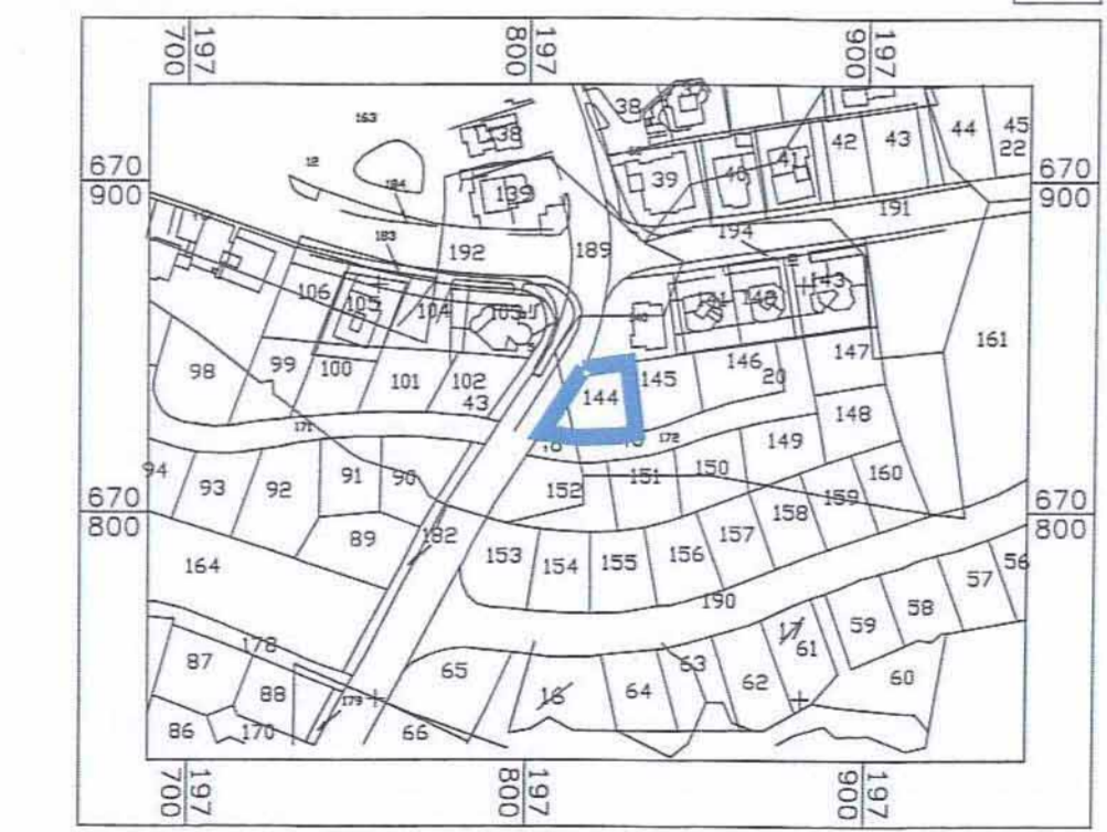
תרשים לסביבה הקרובה קנ"מ 1 : 2500