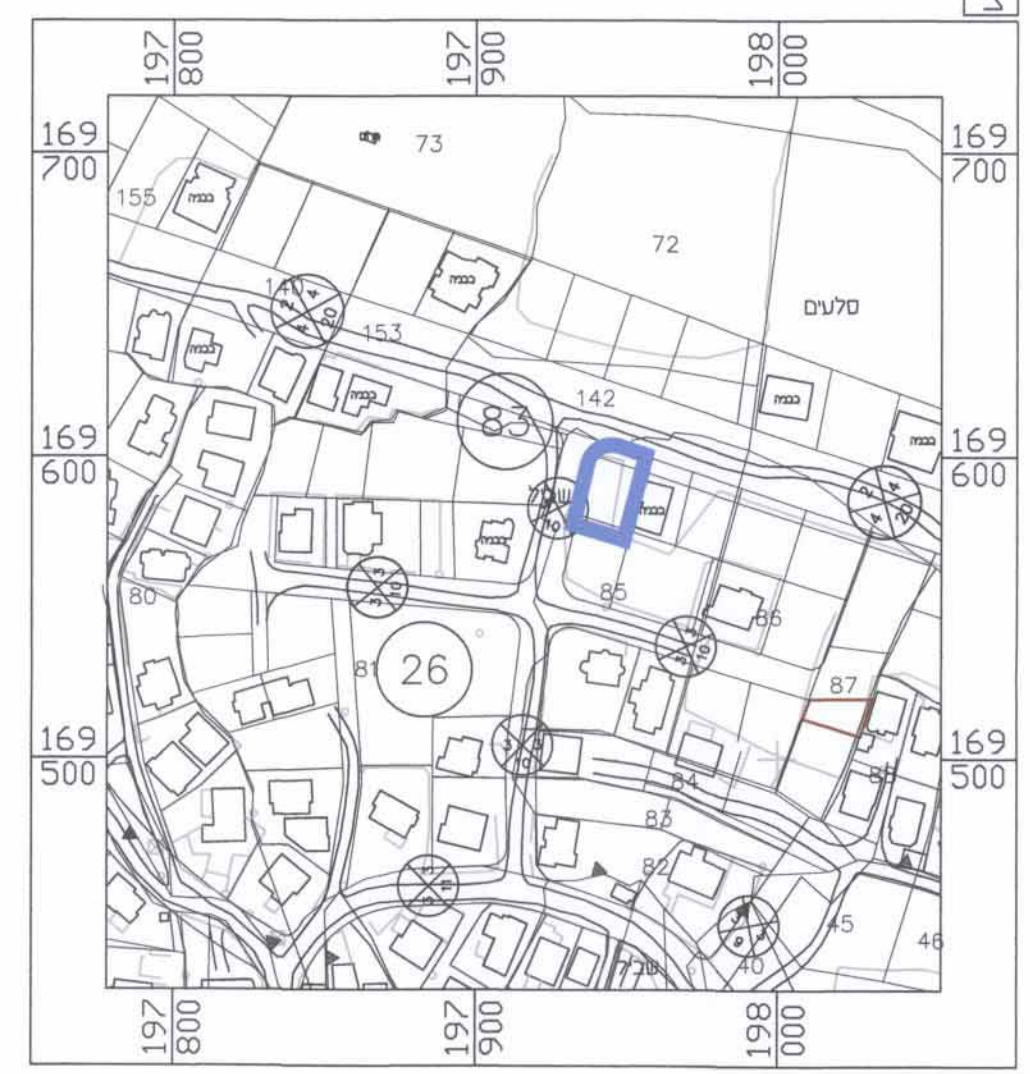
תרשים לסביבה הקרובה קנ"מ 1 : 2500