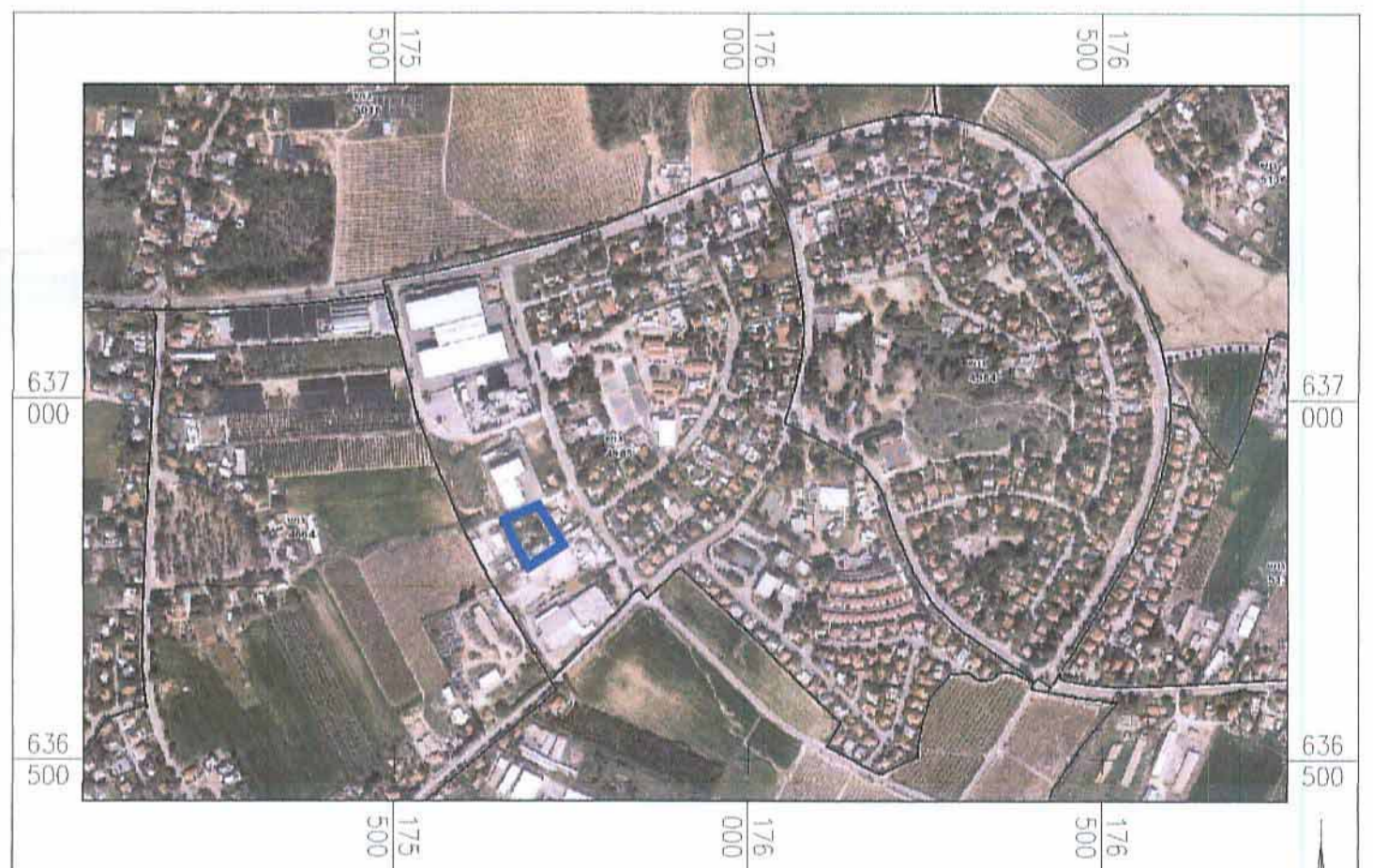
תרשים סביבה ע"פ תצי"א קני"מ 1:10,000

שמות וחתימות: עורך הנספח: שם: ישראל מסילטי חתימה: ישראל מסילטי תאריך: מסילטי אדריכלים בע"מ מ.ר. 104401