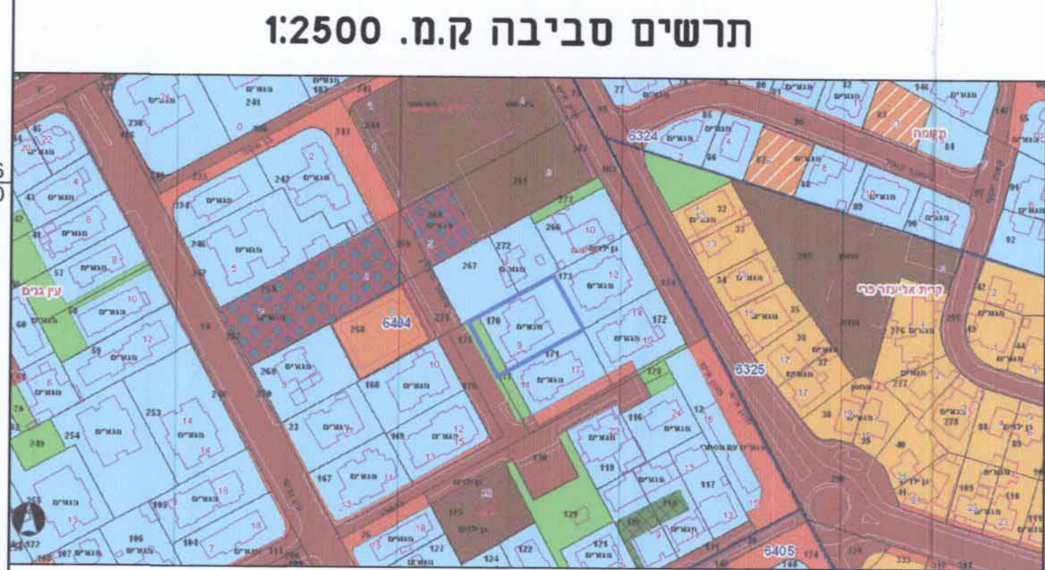
תרשים סביבה ק.מ. 1:2500

ועדה מקומית פתח תקווה חוק התכנון והבנייה, התשכ"ה - 1965 אישור תכנית מס' 410-0257451 התכנית מלאה מכתב סעיף 108 (ג) לחוק חתימה: [Signature] תאריך: 17.10.14