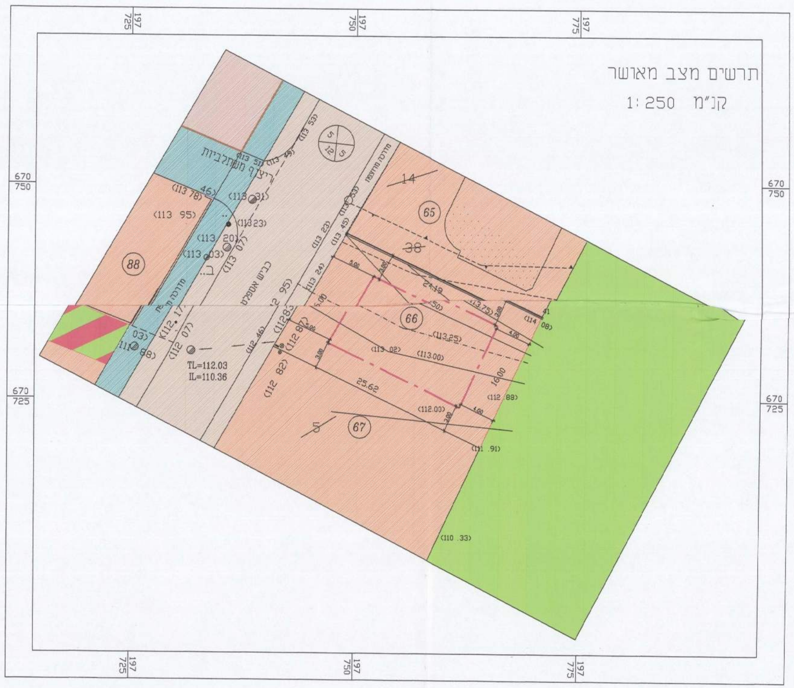
תרשים מצב מאושר קנ"מ 1:250