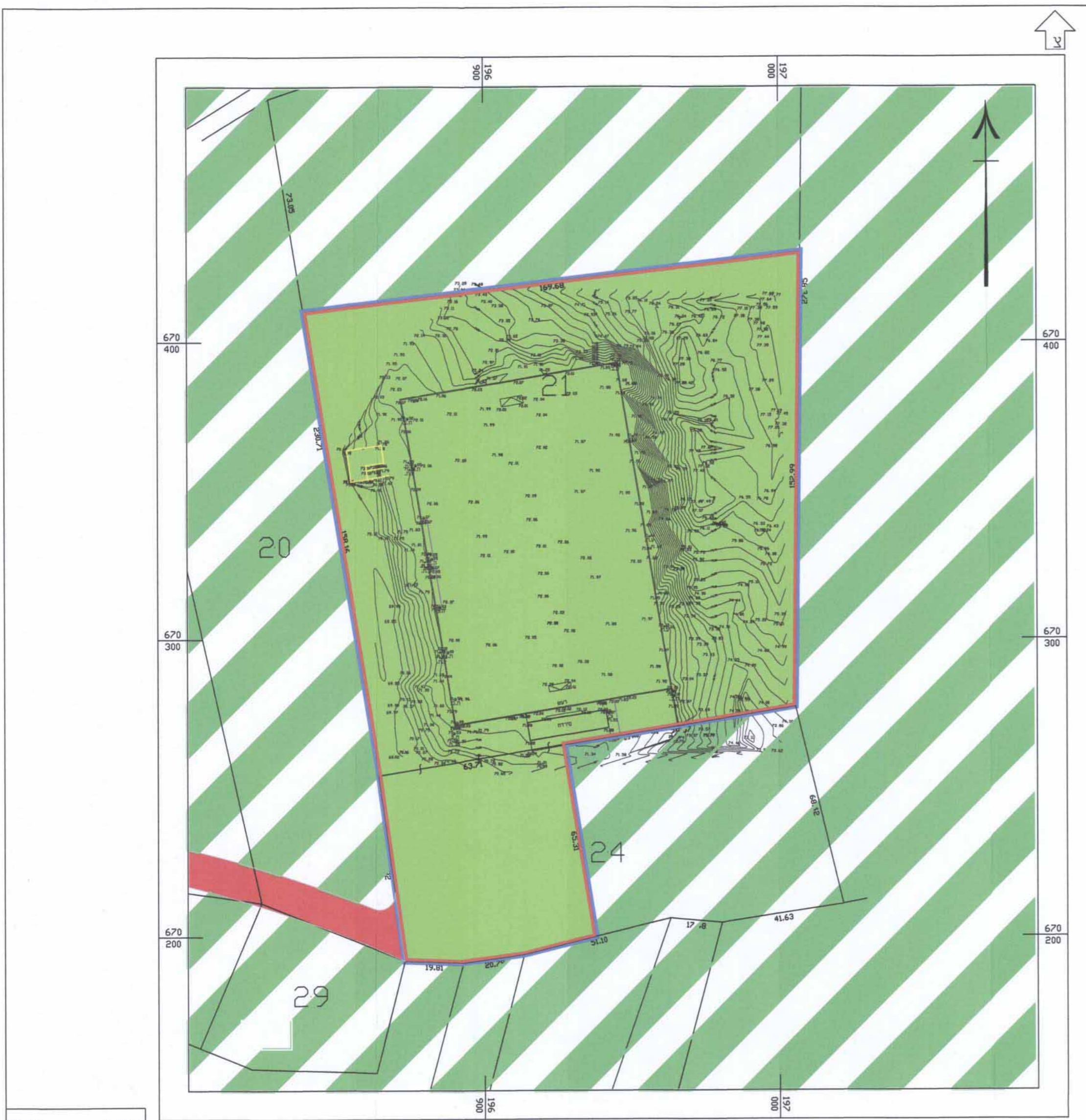
מצב מאושר לפי ק/23000 קנ"מ 1:1250