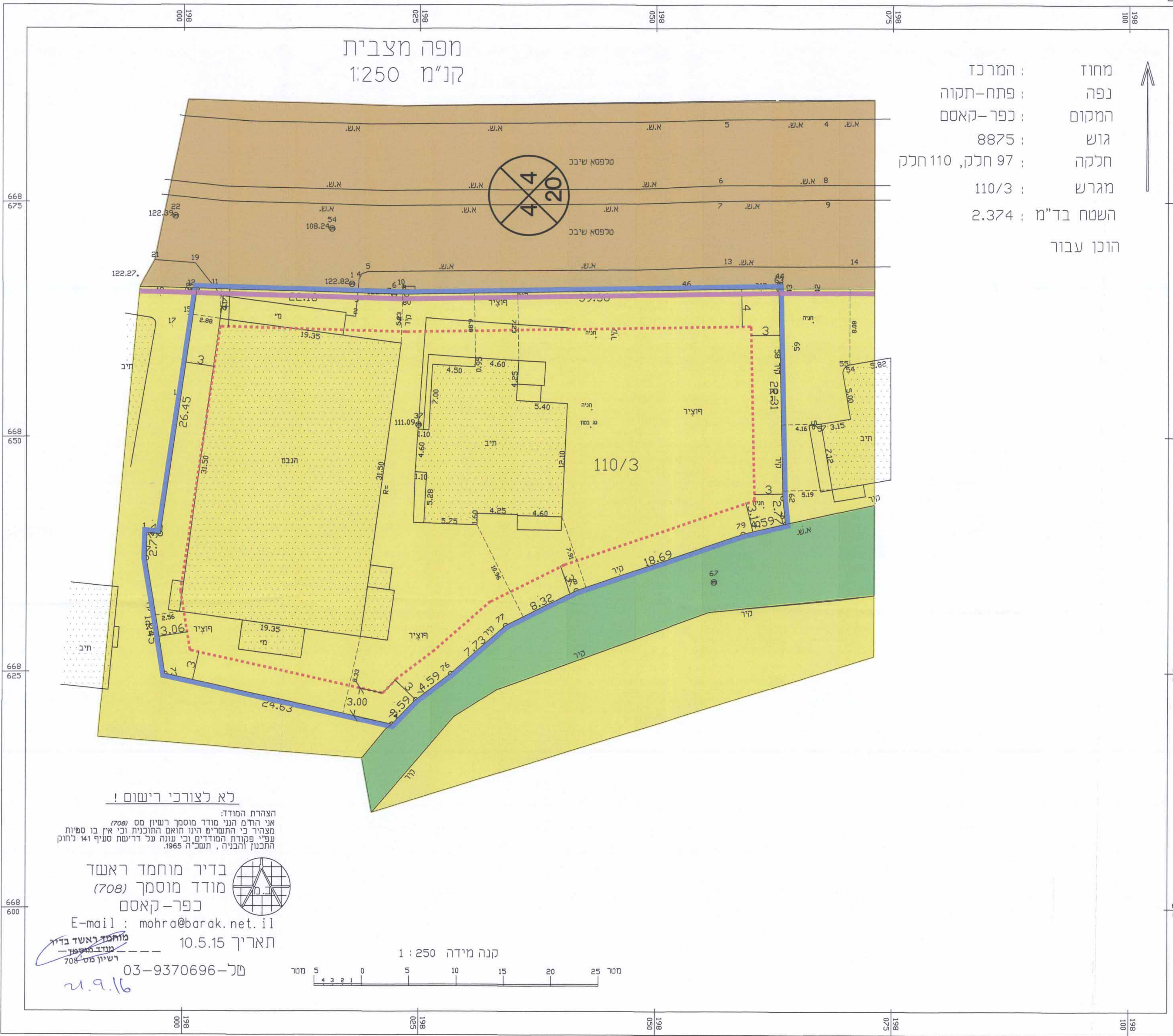
מפה מצבית קנ"מ 1:250

מחוז : המרכז נפה : פתח-תקווה המקום : כפר-קאסם גוש : 8875 תקנה : 97 חלק, 110 חלק מגרש : 110/3 השטח בד"מ : 2.374 הוכן עבור :