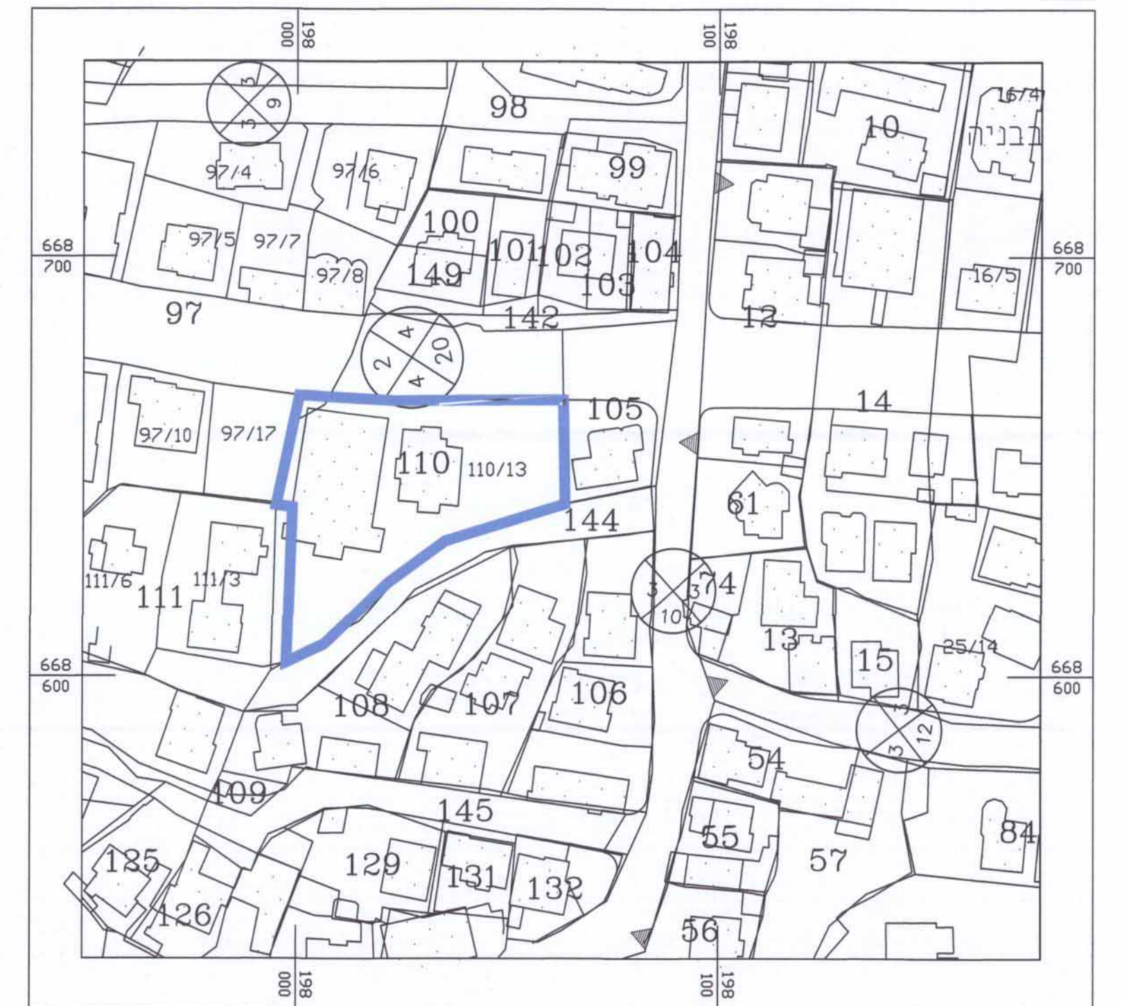
תרשים לסביבה הקרובה קנ"מ 1 : 1250