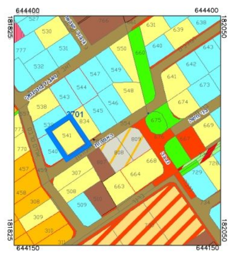
תרשים סביבה קנ"מ 1:2,500