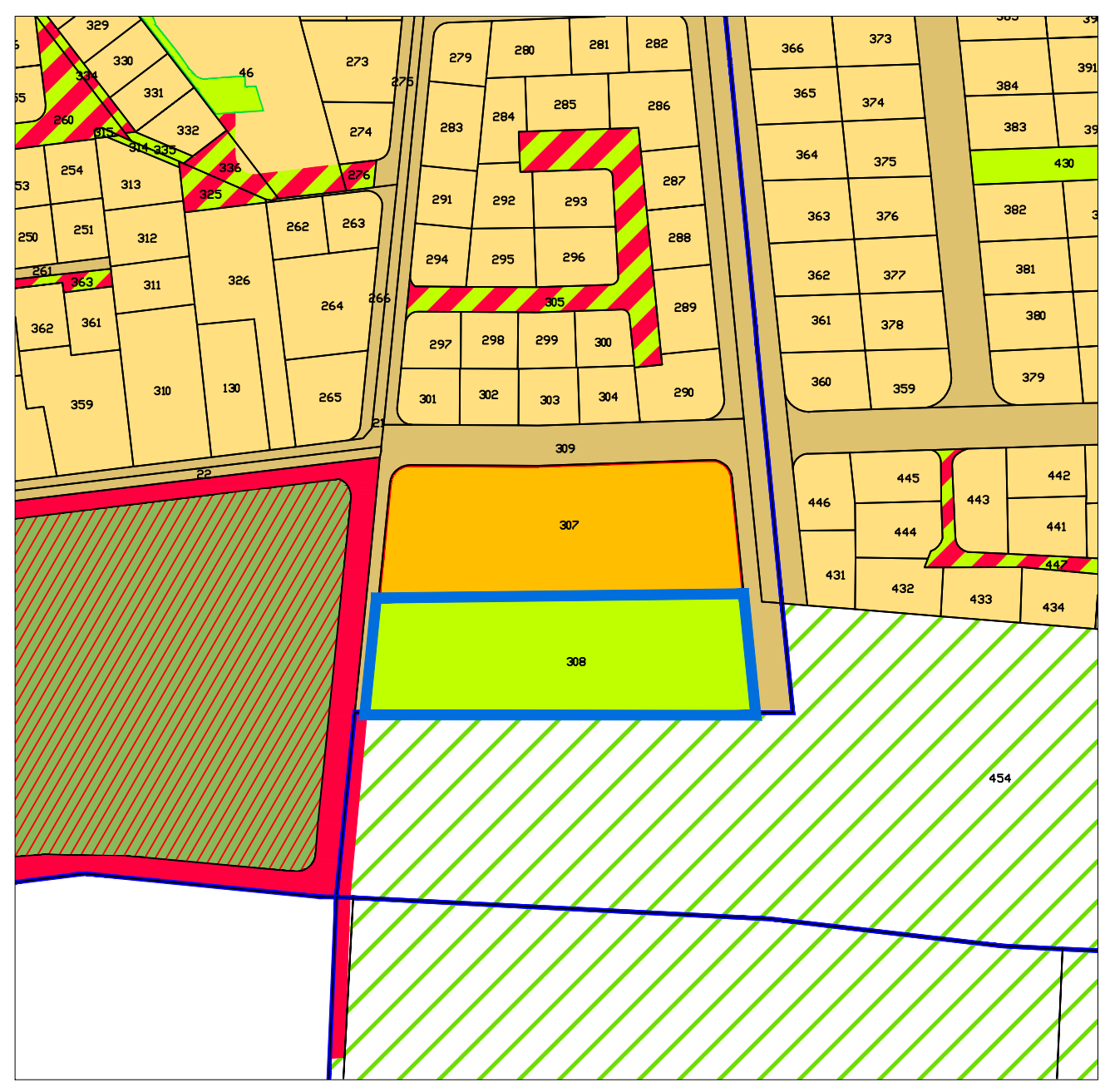
תרשים סביבה קרובה 1 : 2500

חוק התכנון והבנייה, התשכ"ה - 1965 תכנית מפורטת