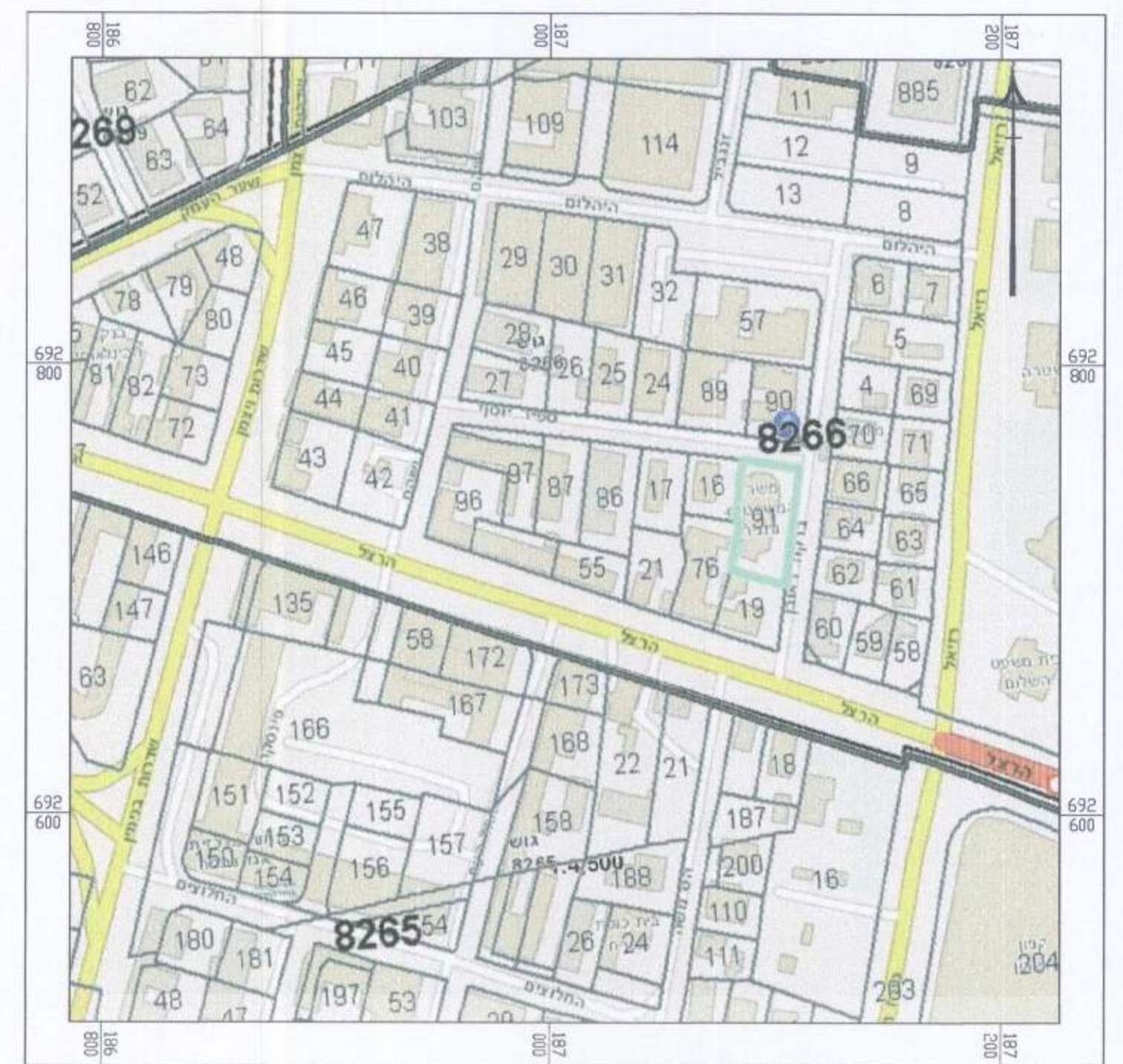
תרשים התמצאות קנ"מ 1:2500