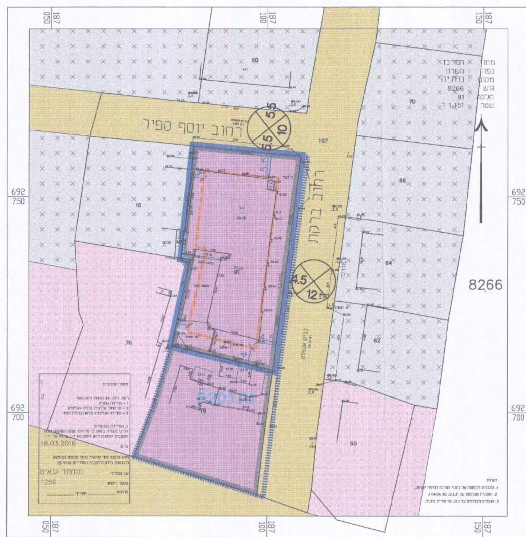
מצב מאושר קנ"מ 1:500

מיטל התכנון - מחוז מרכז חוק התכנון והבנייה, תשכ"ח - 1965 07-5236-408 26.12.16 מס' תכנית: 408-0215236 מס' חלקה: 8266