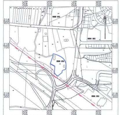
תרשים סביבה קנ"מ 1 : 5,000