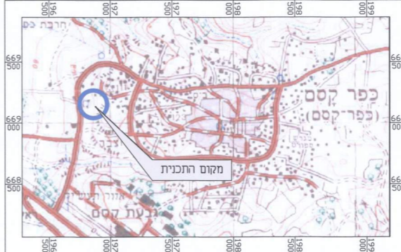
תרשים להתמצאות כללית קנ"מ 1 : 25000