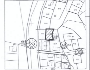
תרשים סביבה קנ"מ 1:2500

הערות: 1. גבולות ושטח המגרש נלקחו לפי תשריט חלוקה מאושר. 2. התכנית לפי ק/3000.