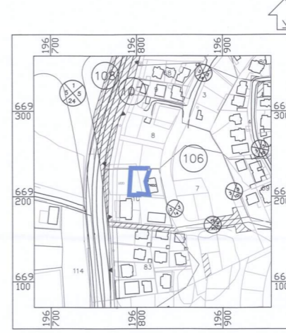
תרשים לסביבה הקרובה קנ"מ 1 : 2500