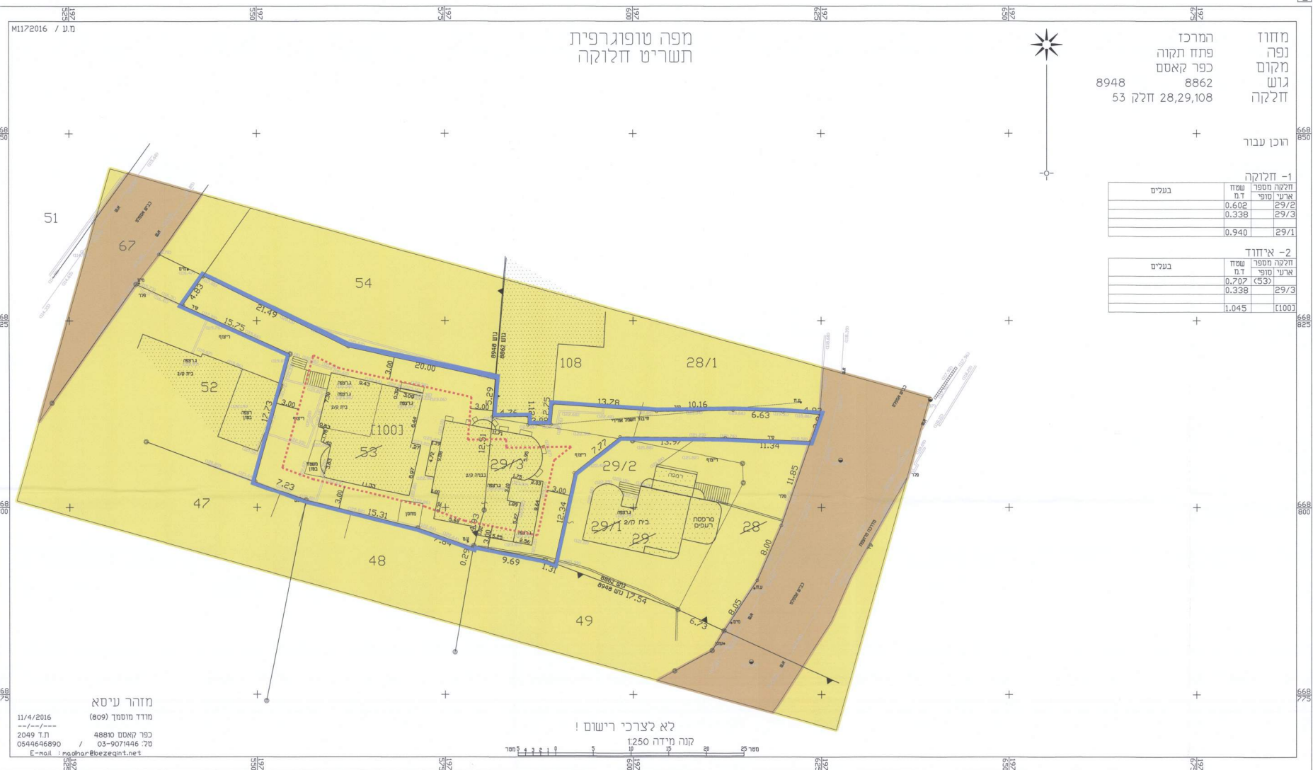
מצב מאושר קנ"מ 1 : 250 לפי תכנית 1/3000 מ

מזהר עיסא מודד מוסמך (809) 11/4/2016 כפר קאסם 48810 ת.ד. 2049 / 03-9071446.70 0544646890 E-mail: mohar@bezeqint.net