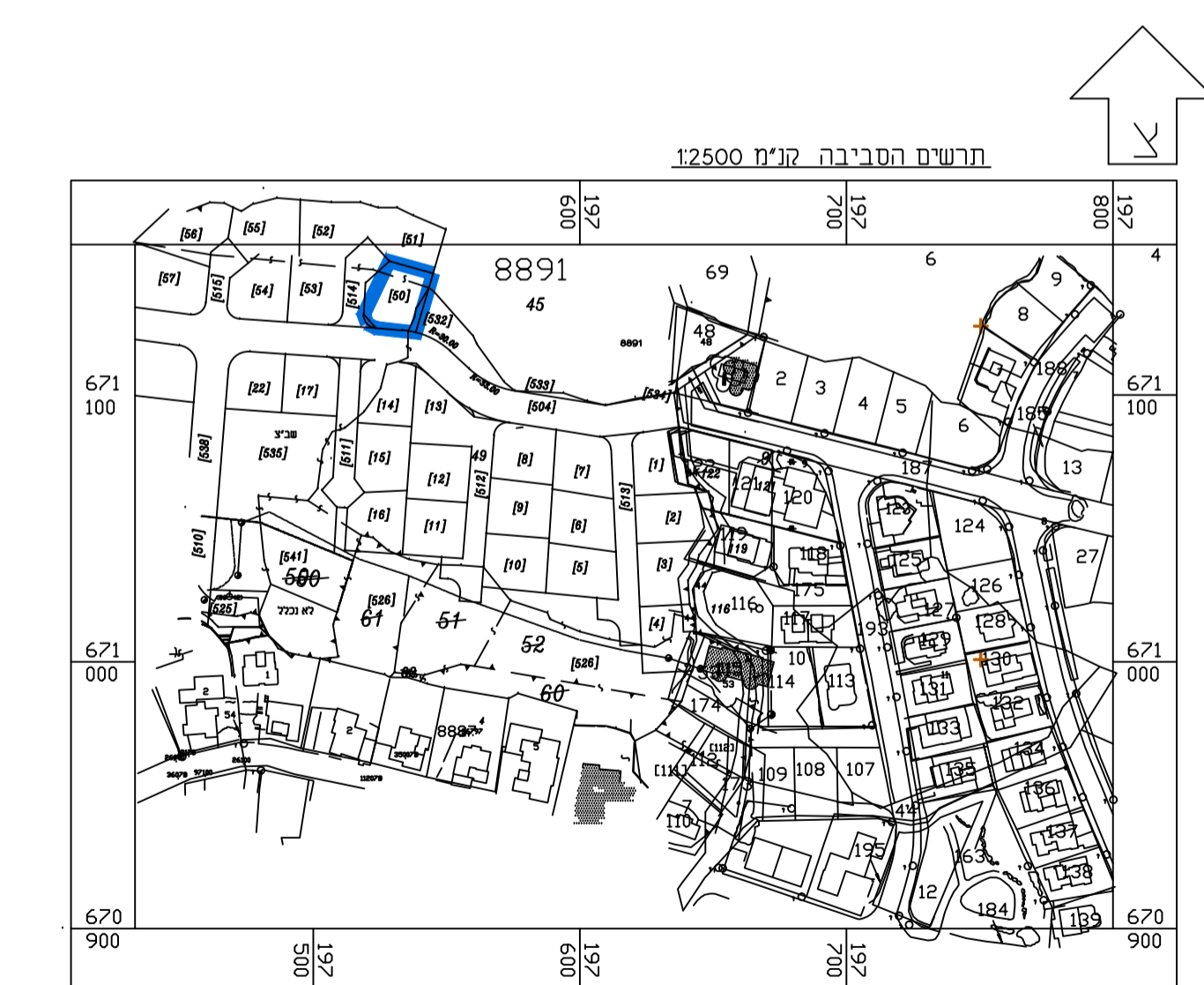
תרשים לסביבה הקרובה קנ"מ 1 : 2500

חוק התכנון והבנייה, התשכ"ה - 1965 תכנית מפורטת