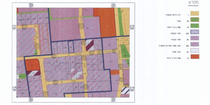
תרשים סביבה 1:5000