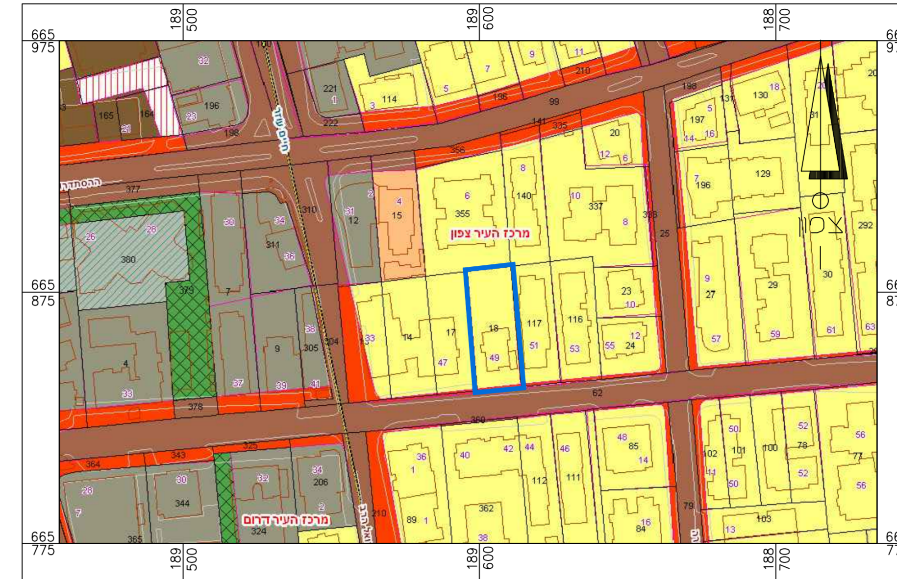
תרשים סביבה קרובה - 1:1,250