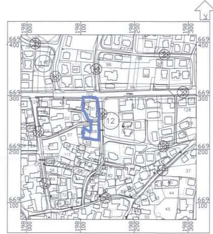
תרשים לסביבה הקרובה קנ"מ 1 : 2500