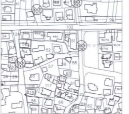
תרשים סביבה קנ"מ 1:2500

הערות: 1. גבולות ושטח החלקה נלקחו ממפת גוש רשום מס' 8869 2. התכנית לפי ק/3000 ולפי 451-0169227 3. התכנית קשורה לרשת הארצית