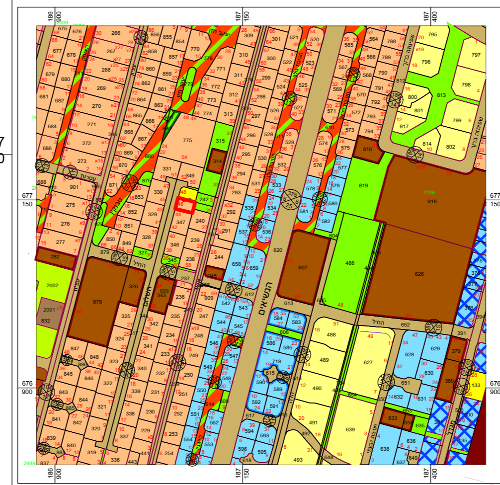
תרשים סביבה קב"מ 1:5000