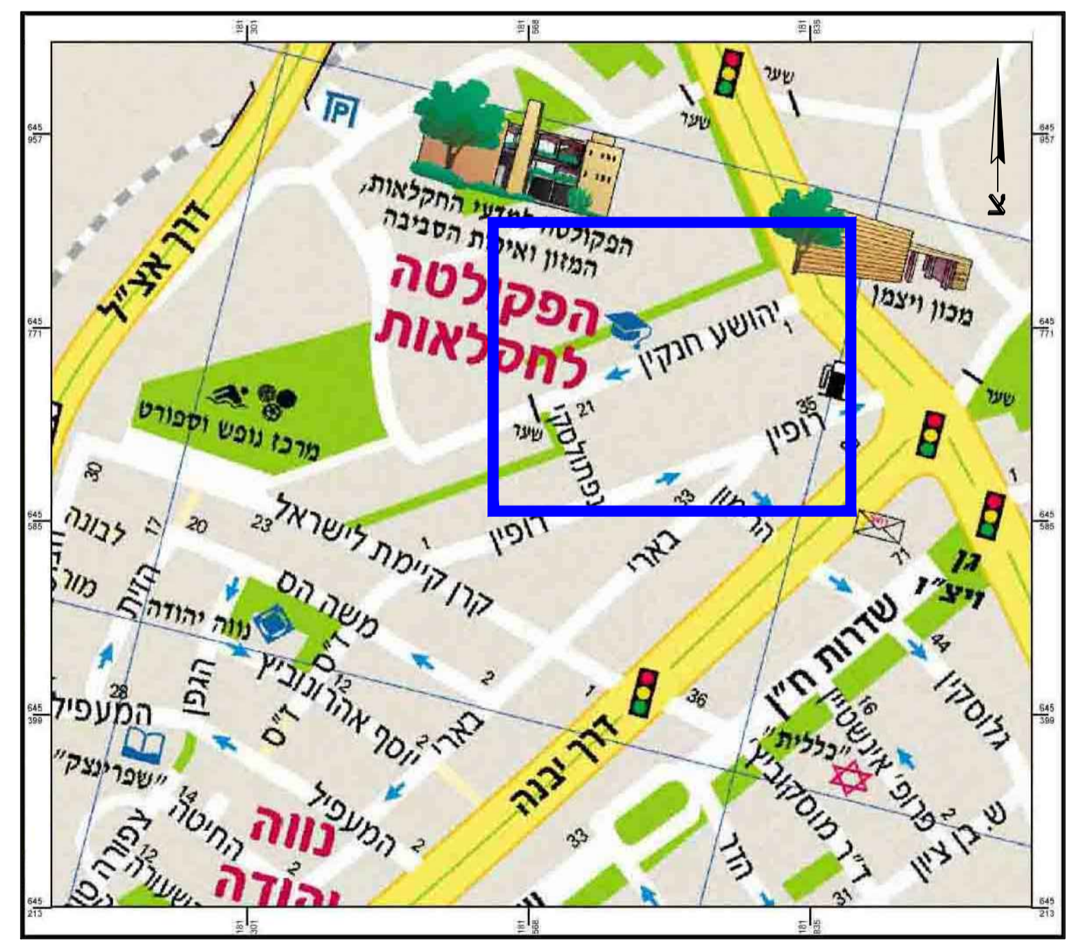
תרישים אזור להתמצאות קנ"מ 1:5000