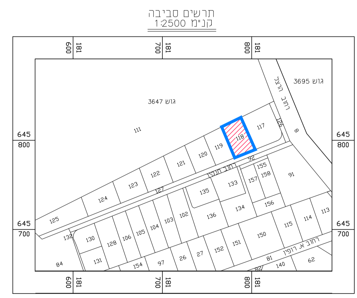
תרישים סביבה 2 קנ"מ 1:2,500