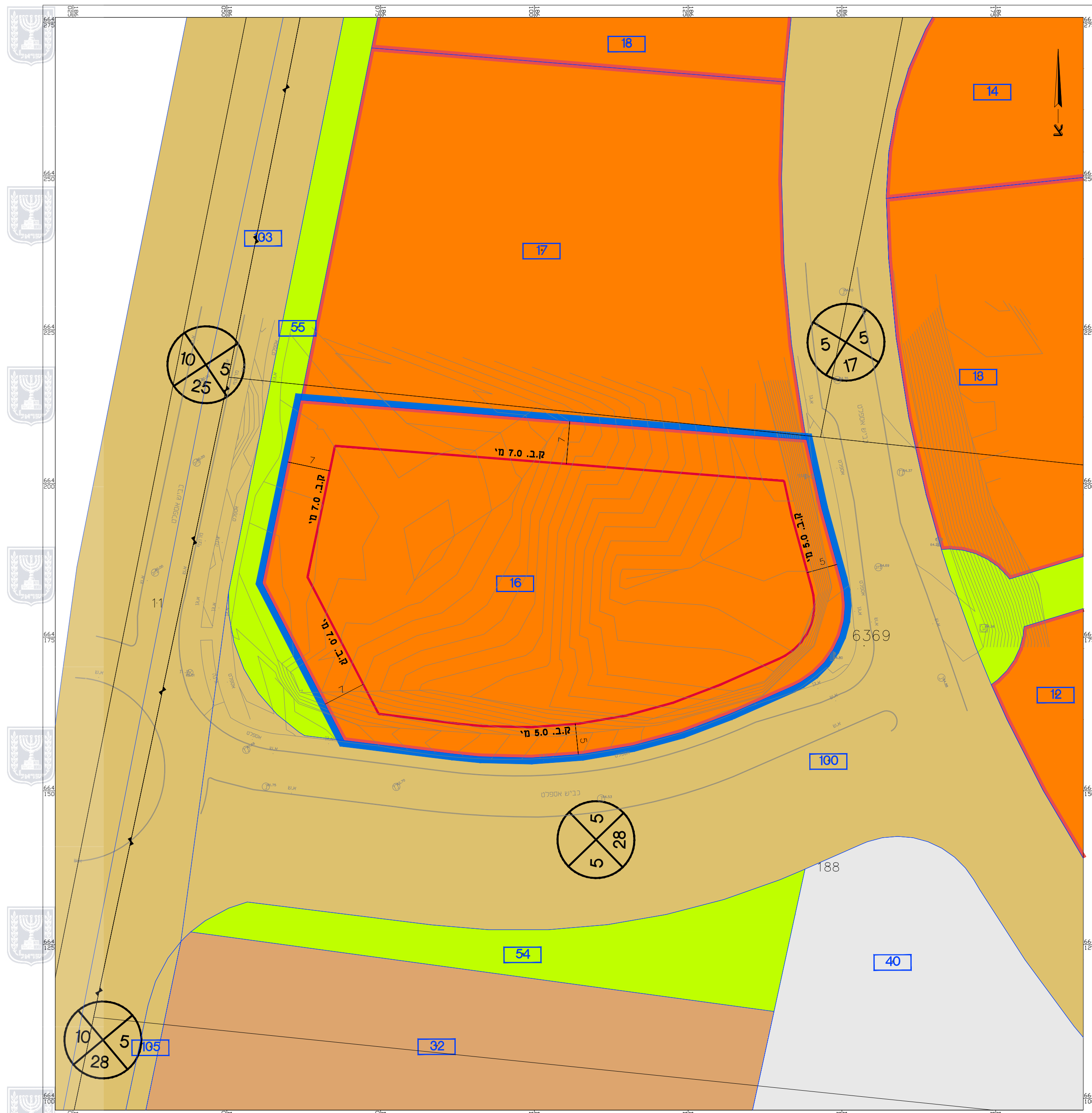
מצב מאושר קנ"ת 1 : 500